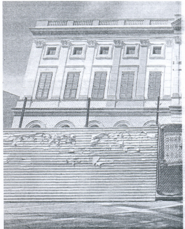
Un hombre transita junto a las obras en la casa consistorial de El Puerto.

Las voces sobre este conflicto con las entidades locales se han multiplicado en las últimas semanas. La última ha provenido del Consejo General de Cámaras de Comercio. Según una encuesta sobre el acceso de las pymes a la financiación, el 82,2% reconoce haber tenido dificultades para saldar sus deudas con la Administración en los últimos tres meses, pero, además, el 60,3% sostiene