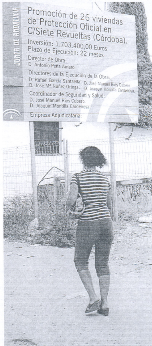
Panel informativo sobre construcción de VPO.

Todo lo contrario es lo que sucede en Guadix. En un año, ha incrementado en un 90% los parados de la construcción. Cuadrillas de albañiles, fontaneros o electricistas que se desplazaban a la Costa del