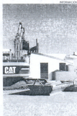
Derribo de la oficina de Turismo.

Las obras que se inician tras el derribo harán posible la construcción de un primer tramo VNI1 que se encuentra en los terrenos del polígono industrial. A este trayecto le seguirá el tramo