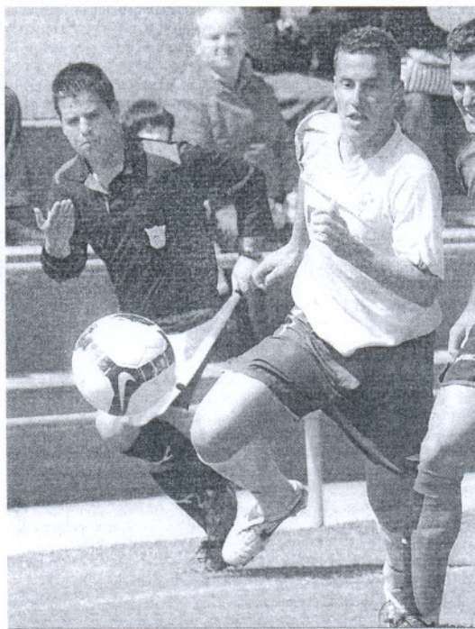
El conileño Narváez se pierde la cita de hoy al estar sancionado.

La dinámica del Conil en las últimas jornadas está siendo espectacular, ya que ha sumado todos los puntos en juego en los últimos cinco compromisos. Los amarillos han pasado por encima del Rota (3-0), Rosal (2-0), La Palma (2-0), Xerez B (3-4) y Roteña