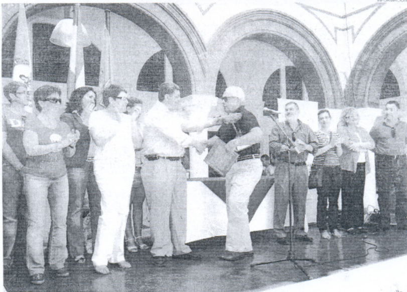
Desde hace cuatro años Medio Ambiente viene potenciando con estos premios el cuidado del entorno.

Según se recogen las bases publicadas por la Fundación Municipal de Medio Ambiente en el caso del premio Medio Ambiente Escolar, podrán optar al premio los centros de enseñanza Primaria y Secundaria de Rota cuyos proyectos o actuaciones realizadas en el transcurso del curso