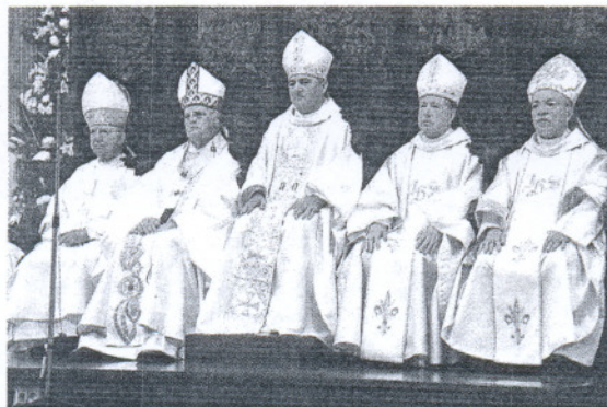
CÁTEDRA. Presidencia de la Catedral jerezana.

La Coral Catedralicia demostró una vez más estar a la altura de las grandes corales