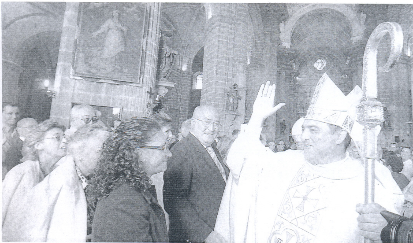
BENDICIÓN. Monseñor Mazuelos bendice a los fieles que quisieron acompañarlo a la Santa Iglesia Catedral.