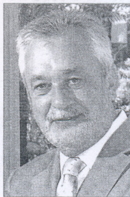
JOSÉ ANTONIO GRIÑÁN Presidente

Hoy cumple 63 años. Diputado por Córdoba. Elegido presidente en abril.