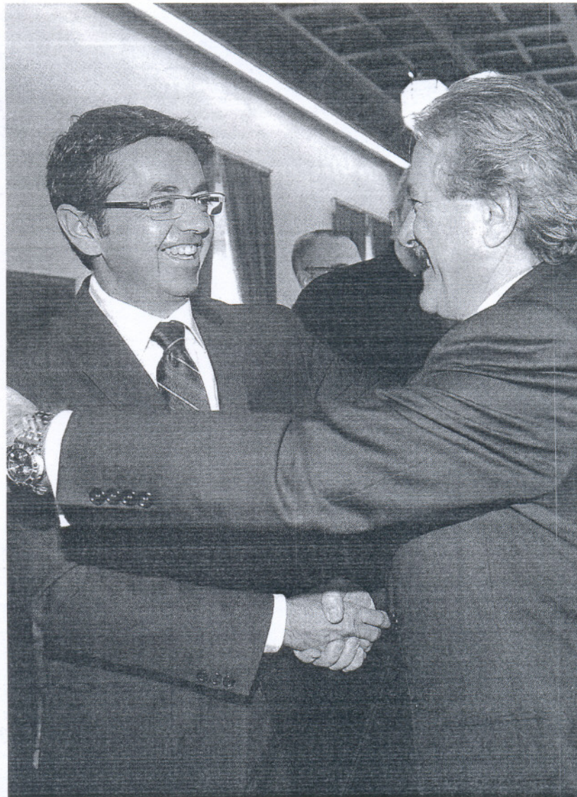
Pablo Carrasco saludado por su predecesor al frente de la RTVA, Rafael Camacho

Los pagos materializados por la Junta de Andalucía a esas 146 empresas públicas en 2007 alcanzaron un valor, según ese informe, de 3.154