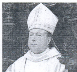
JUAN DEL RÍO MARTÍN ARZOBISPO CASTRENSE

«Reúne una serie de cualidades muy propias para la diócesis de Jerez. Para una diócesis joven, un obispo joven, pero no sólo de edad, sino de mentalidad, con una preparación magnífica. Conecta muy bien con las nuevas realidades gracias a una gran profundidad espiritual». Con estas palabras ratificaba la elección de Mazuelos como obispo de Jerez el cardenal de Sevilla.