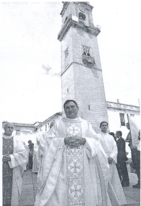
PROCESIÓN. El nuevo prelado, a su llegada a la Catedral.

plegaria de la ordenación. Una vez consagrado como obispo, el sacerdote recibió el anillo, el báculo y la mitra que le acompañarán ya hasta el fin de su ministerio y entre los aplausos de los fieles tomó posesión de la cátedra de la Santa Iglesia Catedral.