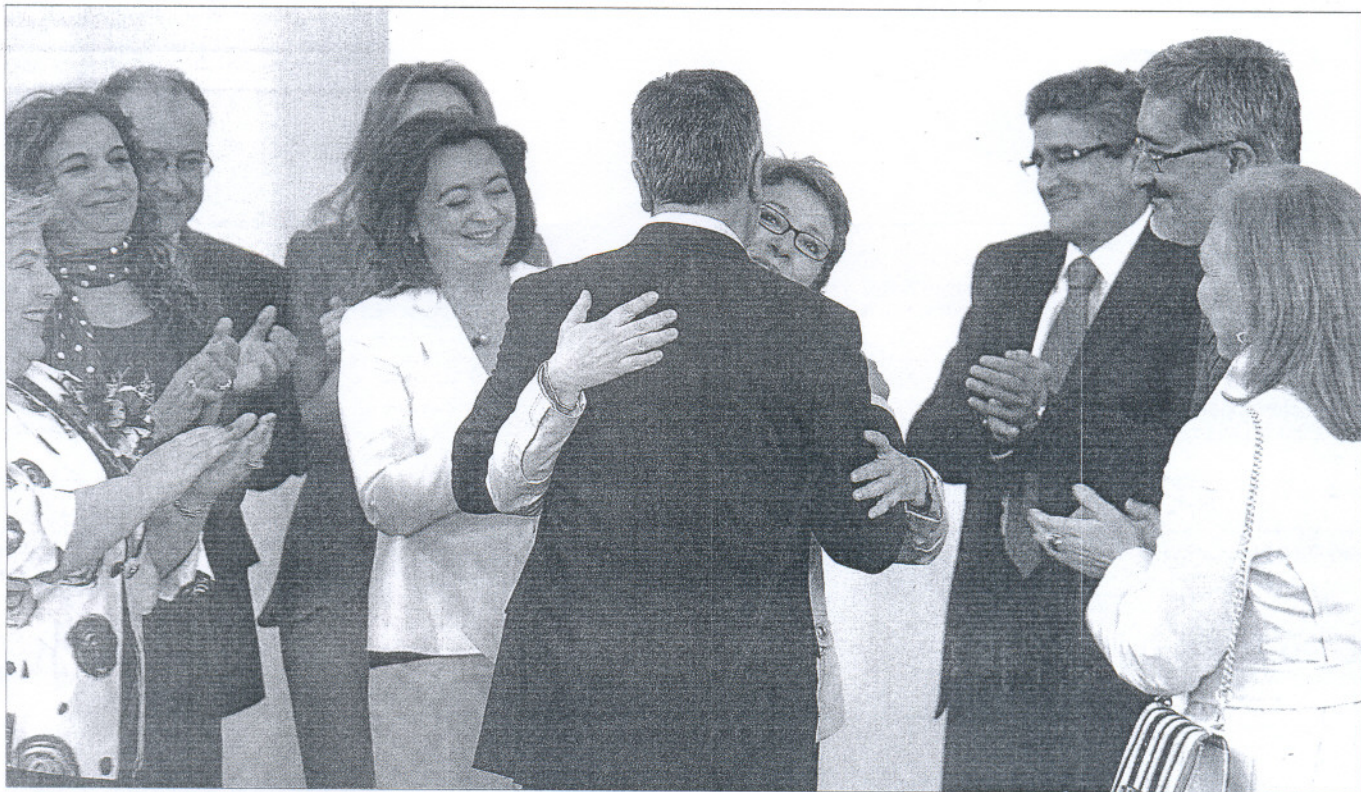
José Antonio Griñán abraza a Carmen Martínez Aguayo, en presencia de varios consejeros durante la toma de posesión del Gobierno el 24 de abril.