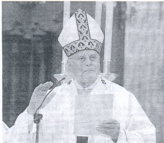
HOMILÍA. El cardenal, en la Catedral.