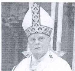
CARDENAL AMIGO ARZOBISPO DE SEVILLA