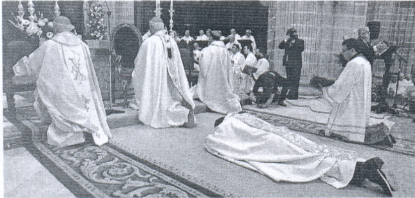
RITO. El nuevo obispo, postrado en el momento de las letanías.

16 Vino El PP pide al Gobierno que autorice la destilación de crisis para el Marco