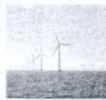
Foto real de un parque eólico marino

Turismo, pesca, salud, cultura, diversión...