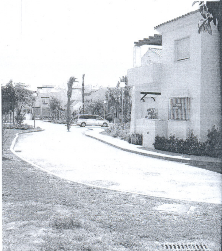
Las primeras viviendas en Costa Ballena de Chipiona se abastecen del agua que les cede Rota