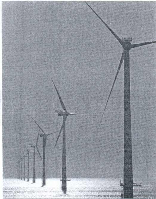
Aerogeneradores marinos en el norte de Europa.

En un comunicado, Magtel explicó que está desarrollando investigaciones para conocer la viabilidad técnica, económica y ambiental del parque, siempre sobre los requisitos y espacios designados en el Estudio Estratégico Ambiental del Litoral Español de diciembre de 2007. "El diseño, la dimensión, la ubicación, las características técnicas, y la tecnología propuestas en el proyecto final serán aquellas que mejor se adapten a las exigencias de esta normativa, de forma que se minimice o se elimine cualquier posible impacto en la pesca, el turismo, la navegación aérea y marítima, la seguridad, el medio ambiente y el paisaje", apuntó Magtel, que insistió en que Las Cruces del Mar , "debido a su envergadura y al desarrollo técnico que pre-