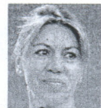
SECRETARIA GENERAL DEL PP

Insiste en acusar al Gobierno de espíar a su partido sin presentar denuncia alguna y, por ahora, sin pruebas. El principal partido de la oposición tendría que sustentar sus afirmaciones en hechos ciertos.