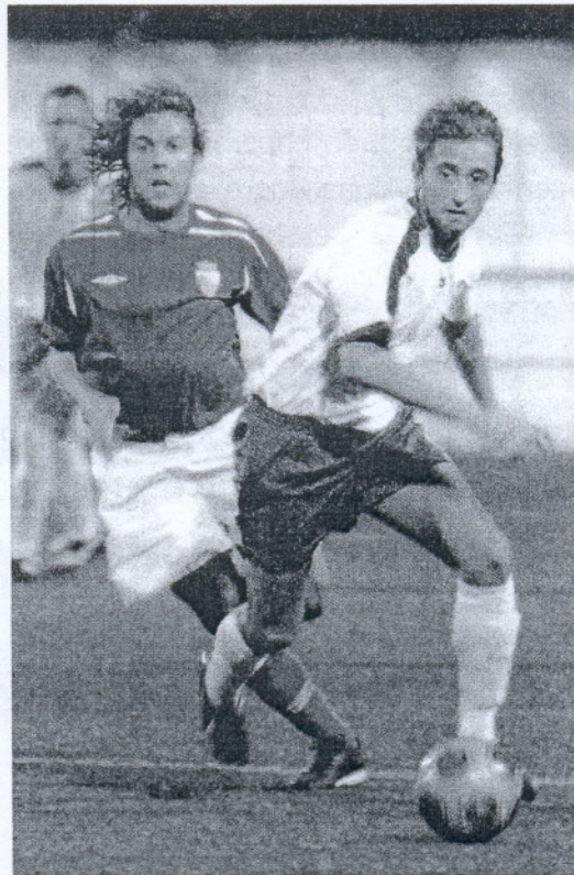
El pulso se mantuvo equilibrado en la primera mitad.

Antes, en la consolación inicialmente no prevista, el Cádiz B goleó 1-6 al Chiclana Industrial.