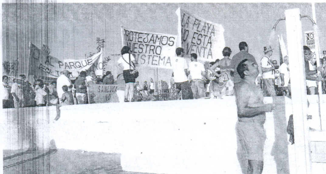
Un bañista en la ducha mientras decenas de manifestantes marchan con pancartas en el paseo marítimo de Chipiona.