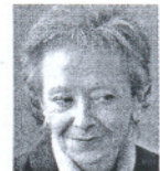
VICEPRESIDENTA DEL GOBIERNO

La extensión del subsidio de paro deja fuera de cobertura a 600.000 desempleados, pese a la promesa de ampliación. Una discriminación que no se entiende. La política social no debería ser propagandística.