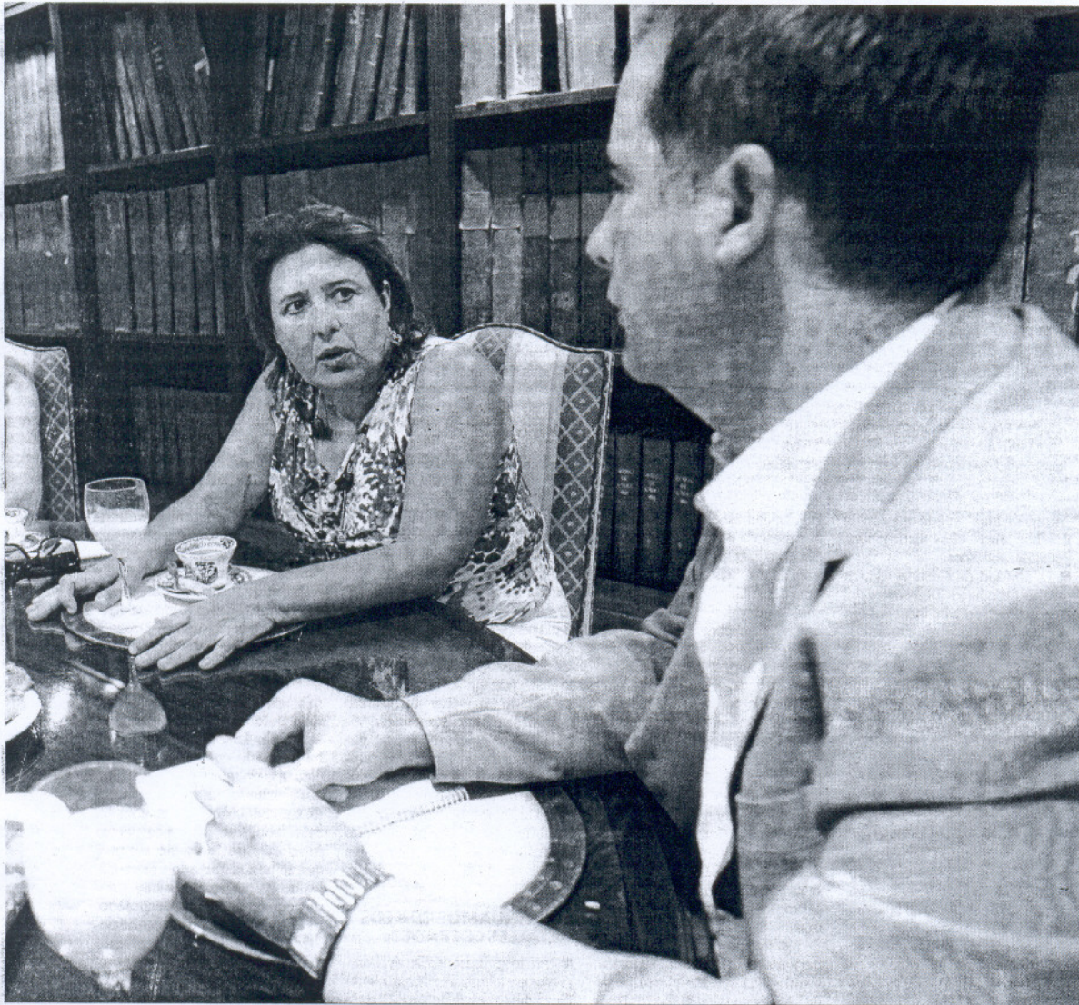
ayer en la sede central de 'Diario de Cádiz'.

La delegada resalta la importancia que tiene la implicación de los padres en el proceso educativo de sus hijos