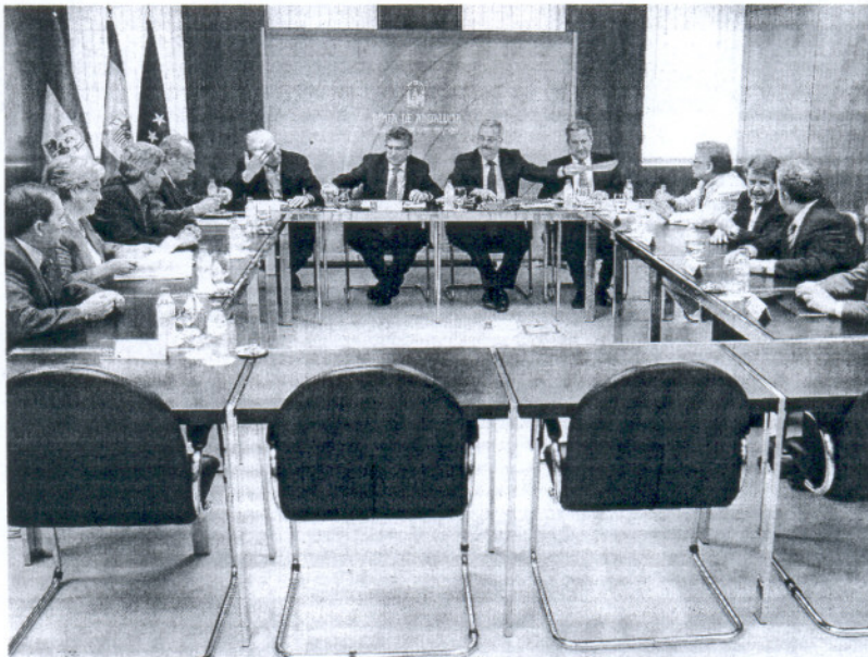
Los consejeros de Gobernación y Empleo, ayer, reunidos con los presidentes de las ocho diputaciones.

La evolución del Proteja —es el equivalente al Plan E del Gobierno