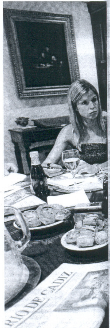
La delegada provincial de Educación (en el centro).

“Yo no soy nadie para decirle a los ayuntamientos lo que deben hacer —repetió la responsable educativa—, pero sí puedo pedirles que aborden su competencia. Es decir, que me verifiquen el censo porque me están diciendo que una persona no vive donde dice. Deben comprobarlo. Y son los ayuntamientos también los que deben solicitar a la Policía Local que investigue esos casos”.