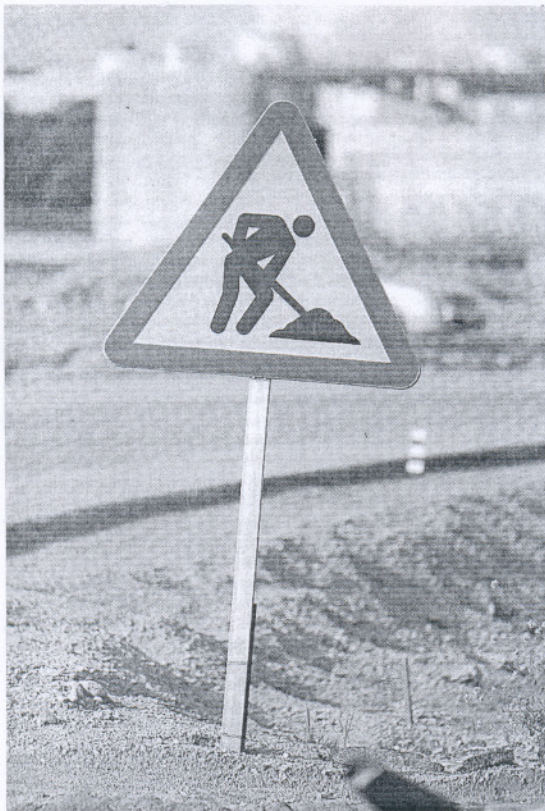
TAJO. La provincia recibe 48,4 millones para obras.

En total se generarán 2.422 empleos, aunque la duración de éstos rondará sólo los seis meses. El Ayuntamiento que ha conseguido sacarle un mayor partido a la