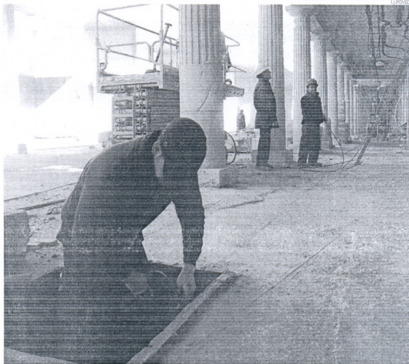
El desempleo en el mes de febrero se ha incrementado un 2,15 por ciento con respecto al mes de enero.

Así señala que, las actividades agrícolas y ganaderas registran una subida del paro del 1,7 por ciento en Cádiz, que se traduce en 121 personas más inscritas en el SAE (a nivel andaluz, la agri-