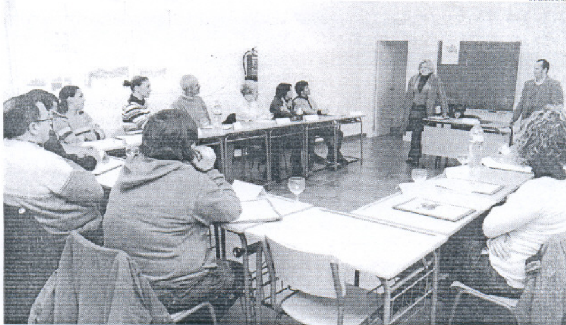
Los alumnos han recibido conocimientos acerca de los vinos de la manera óptima de conservarlos y servirlos.

Las clases, en las que han participado empleados y propietarios de establecimientos de hostelería de la ciudad como Café Museo,