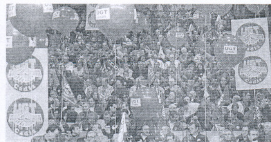
Se congregaron más de mil personas. / O. CH.

El colectivo de ex eventuales de Delphi mantiene el encierro que inició el lunes en el edificio de los sindicatos de la capital en demanda de igualdad de condiciones con el resto de afectados por el cierre de la fábrica de componentes de automoción en agosto de 2007. Exigen el cobro de prestaciones por desempleo y que también se les aplique el contador a cero que la Junta prometió al resto de trabajadores afectados. Un representante de los ex eventuales, Jesús Dávila, mantuvo un encuentro con los secretarios regionales y provinciales de CC OO y UGT, que, según informó el desempleado, se comprometieron a hablar con sus respectivas federaciones del metal para buscar una salida a su situación y emitir un comunicado al respecto. Dávila se mostró satisfecho de la reunión, aunque informó de que mantendrán su encierro hasta que ambas formaciones sindicales se posicionen de forma inequívoca en apoyo de las demandas de este grupo de desempleados. Sin embargo, ni Pastrana ni Carbonero dieron ningún plazo para cumplir lo pactado con los representantes del colectivo. En la jornada de hoy tienen previsto un encuentro con el vicesecretario regional socialista, Luis Pizarro. El delegado de Empleo, Juan Bouza, manifestó ayer al respecto que no tiene nada que decir y se remitió al protocolo suscrito por la Junta y los trabajadores en 2007.