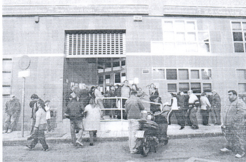
Numerosas personas hacen cola en una oficina del Servicio Andaluz de Empleo (SAE) de Málaga capital.

El número de contratos en febrero se situó en 296.929, es decir, 34.396 menos (10,38%), de los que 12.988 fueron indefinidos, lo que supuso un descenso de 757