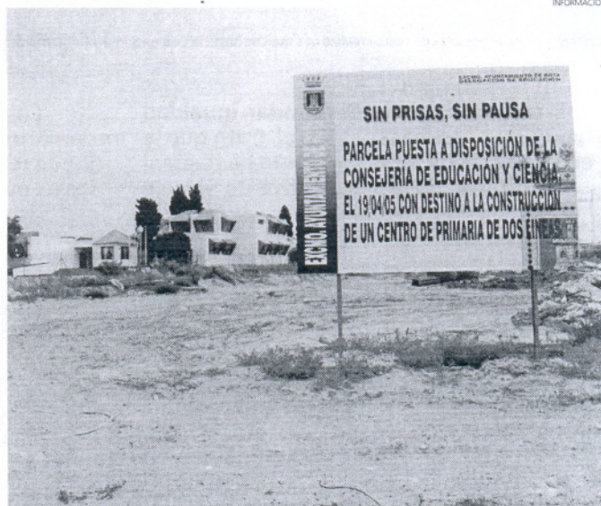
El ayuntamiento ha cedido una parcela a la Junta para la ubicación de un nuevo centro escolar.