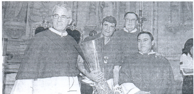
CATEDRAL. La derecha de la imagen, cuando el Sevilla festejó una Copa de la UEFA.