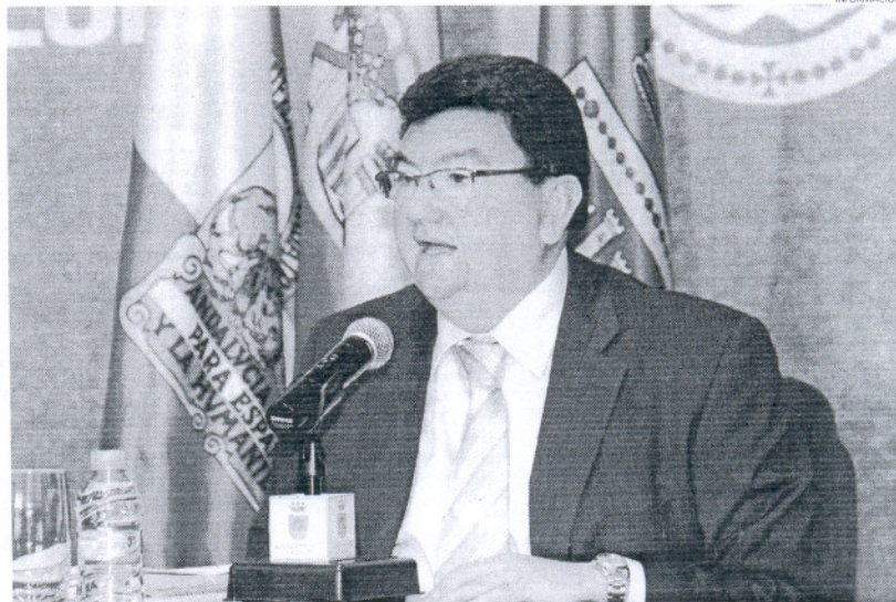
El alcalde considera que la actitud de la consejera ha sido "receptiva y de compromiso" ante las necesidades de Rota.