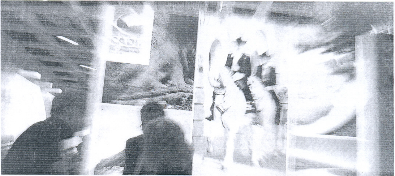
PROMOCIÓN. Imagen general de la muestra berlinesa, frente al expositor de la provincia, en el que se detuvieron muchos asistentes interesados.