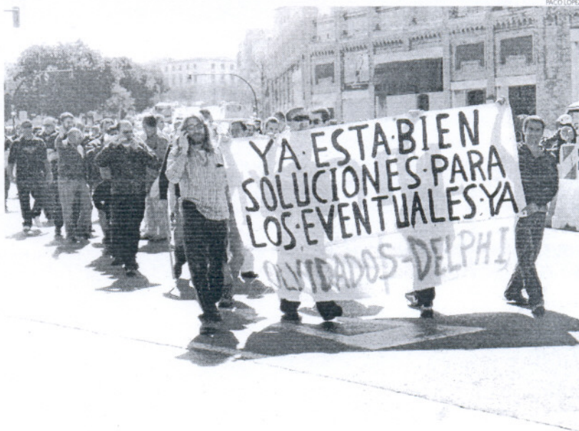
El colectivo de ex eventuales de Delphi realizó una marcha hasta la Delegación del Gobierno de la Junta.

En este marco, los ex eventuales de Delphi realizaron hoy una marcha a la Delegación del Gobierno de la Junta en Cádiz, donde entregaron un escrito solicitando "ayuda" al delegado, José