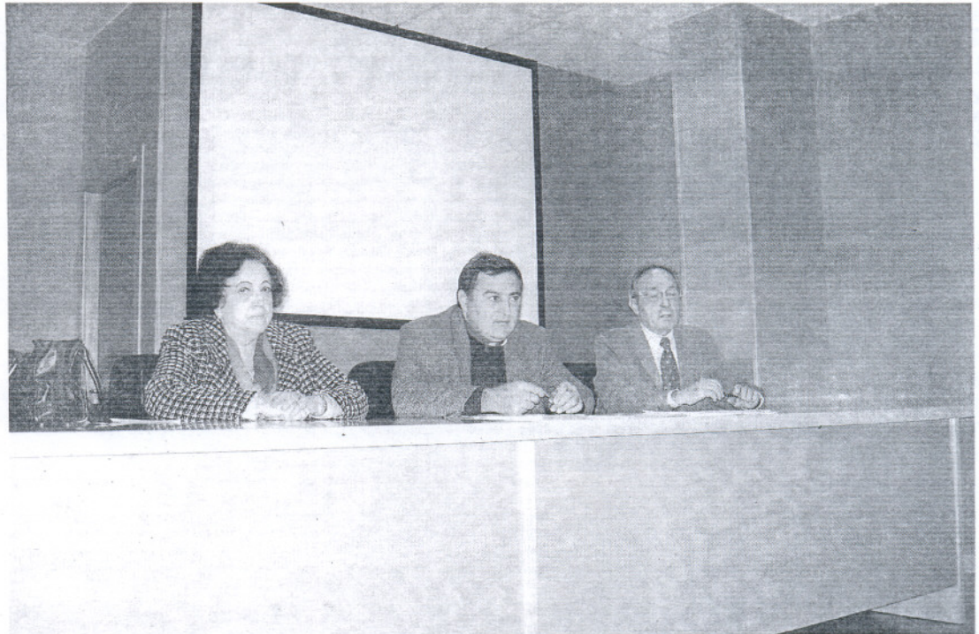
EN JEREZ. En el centro, durante su intervención en un foro de debate celebrado en diciembre de 2007.