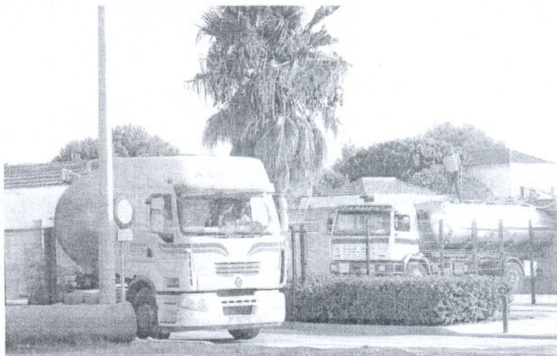
Un camión cisterna descarga ayer agua en el depósito de Costa Ballena.

Para acelerar la mejoría de las reservas, el Ayuntamiento de Rota ha contratado con dos empresas de Jerez y Málaga diez camiones cisterna que desde ayer captan agua en Rota y El Puerto y la descargan directamente en el aljibe de Costa Ballena. En la localidad roteaña, las tomas se hacen en las zonas bajas de la ciudad, las más cercanas a la urbanización, a través de las bocas de incendio y de riego. En El Puerto se recoge en los depósitos del Consorcio de Aguas de la Zona