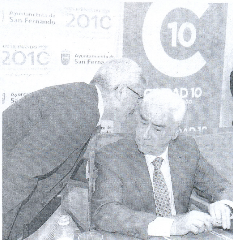
COMPROMISO. El consejero ya ha iniciado contactos con el Gobierno para ampliar los proyectos.

Aquel primer borrador que se parecía mucho a al que redactó el Ayuntamiento ya se encuentra avanzado, según aclaró ayer Alonso, y se extenderá a más servicios, entre ellos ocio, transporte y playas. Durante la elaboración de esta estrategia se toma como modelo un turista exigente. «Los visitantes esperan una gran planta hotelera y un itinerario de consumo determinado». El término incluye servicio de taxi, restaurante, ocio y hasta limpieza de las playas, según explicó el consejero que trabaja en esa idea para mejorar el plan anunciado a principios de junio.