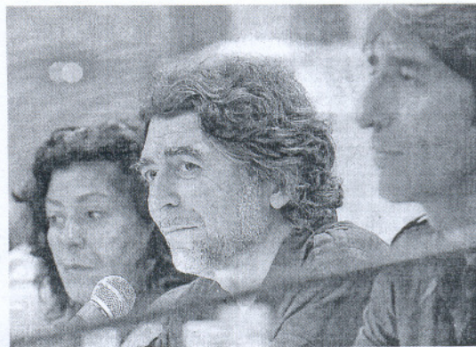
NOCHE DE POETAS. Almudena Grandes, Sabina y Benjamín Prado.