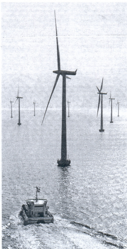
Un barco se adentra en un parque eólico en aguas del norte de Europa.

La empresa, antiguo Grupo De-tea, es una pujante firma dedicada a la promoción, desarrollo y gestión de proyectos en los sectores inmobiliario, de las energías renovables, el reciclado de residuos y la agroindustria. Cuenta con una plantilla de 200 personas y un volumen de negocio anual superior a los 100 millones de euros, y tiene intereses en España, Portugal, Polonia, Rumanía, Bulgaria, Chile y México. El grupo también mantiene en cartera varios proyectos turísticos en Cádiz.