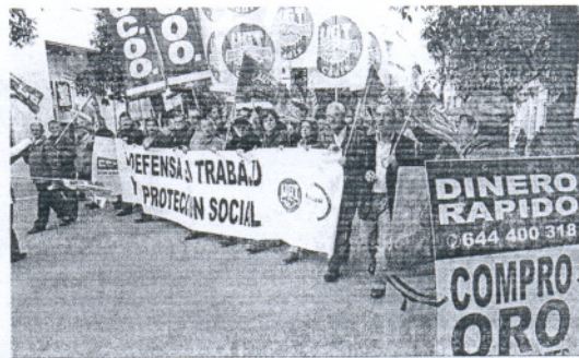
Un espontáneo con un cartel de “compro oro”, en la cabecera.

En algunas de las pancartas se leían lemas análogos al de la cabecera de la manifestación, “por el empleo”, mientras otras, más reivindicativas, hacían alusión expre-