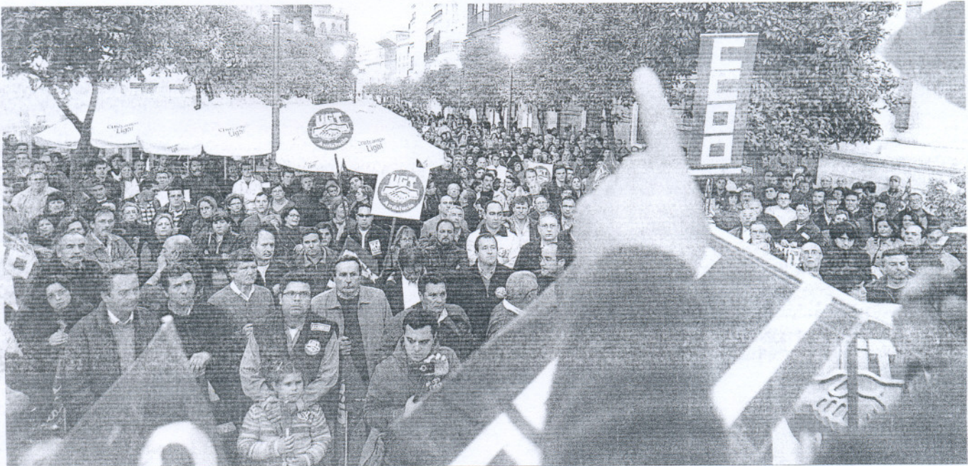
Centenares de jerezanos en la manifestación por el empleo convocada por los sindicatos CCOO y UGT ayer en la ciudad.