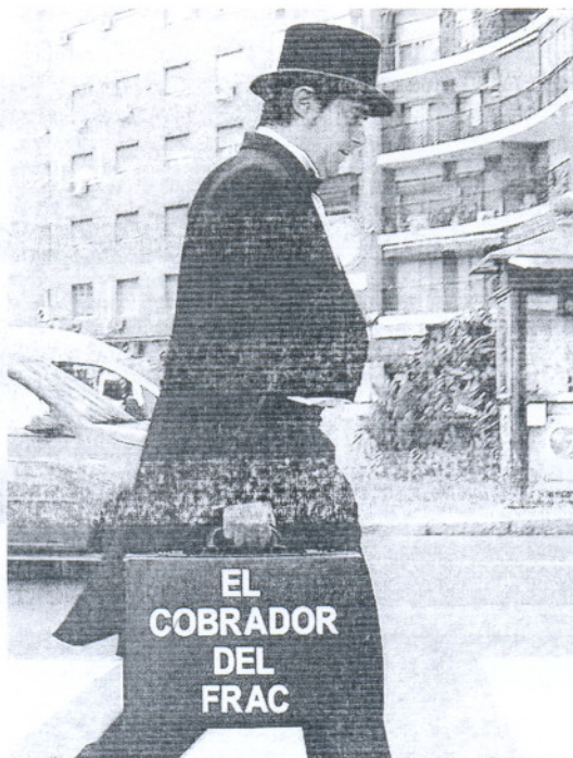
La figura del cobrador del frac ha cobrado mayor protagonismo con la crisis

Gráfico: Dpto. de Infografía.