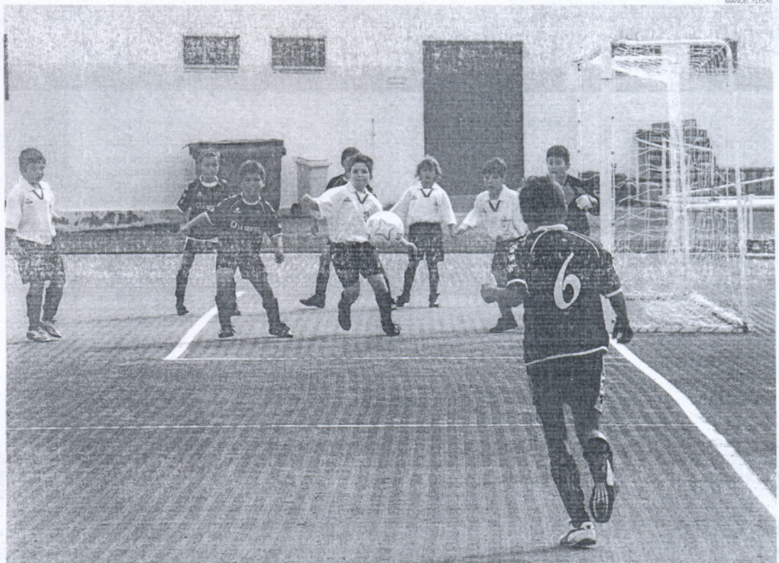
Una imagen del partido que midió a La Salle de Puerto Real y al Domingo Savio de categoría Prebenjamín.

En el Grupo 3 se ha producido otra de las noticias del fin de semana, ya que la Roteña se ha proclamado campeona por delante del Atleti Sanlúcar. Los roteños vencieron por 4-1 en el derbi con el Rota. Al Atleti Sanlúcar le sirvió de poco el 2-4 que logró ante el CD Sanlúcar. Por último, en el Grupo 5 ganaron todos los de arriba, ya que el líder Safa San Luis B le endosó una docena al Novo Chiclana B y el Sanluqueño B ganó por la mínima al Divina Pastora.