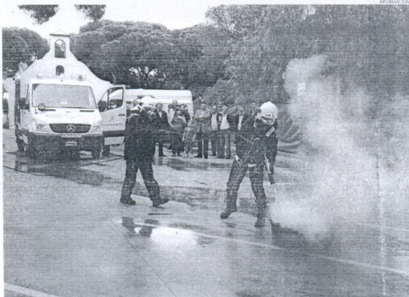
El nuevo vehículo viene a aumentar el parque móvil con el que en estos años se ha dotado a Protección Civil.