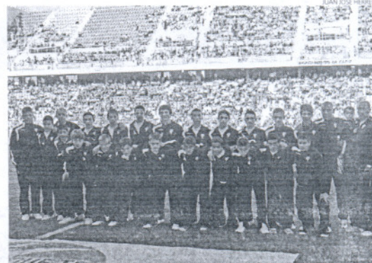
El Cádiz celebró el título de campeón en el estadio Ramón de Carranza.