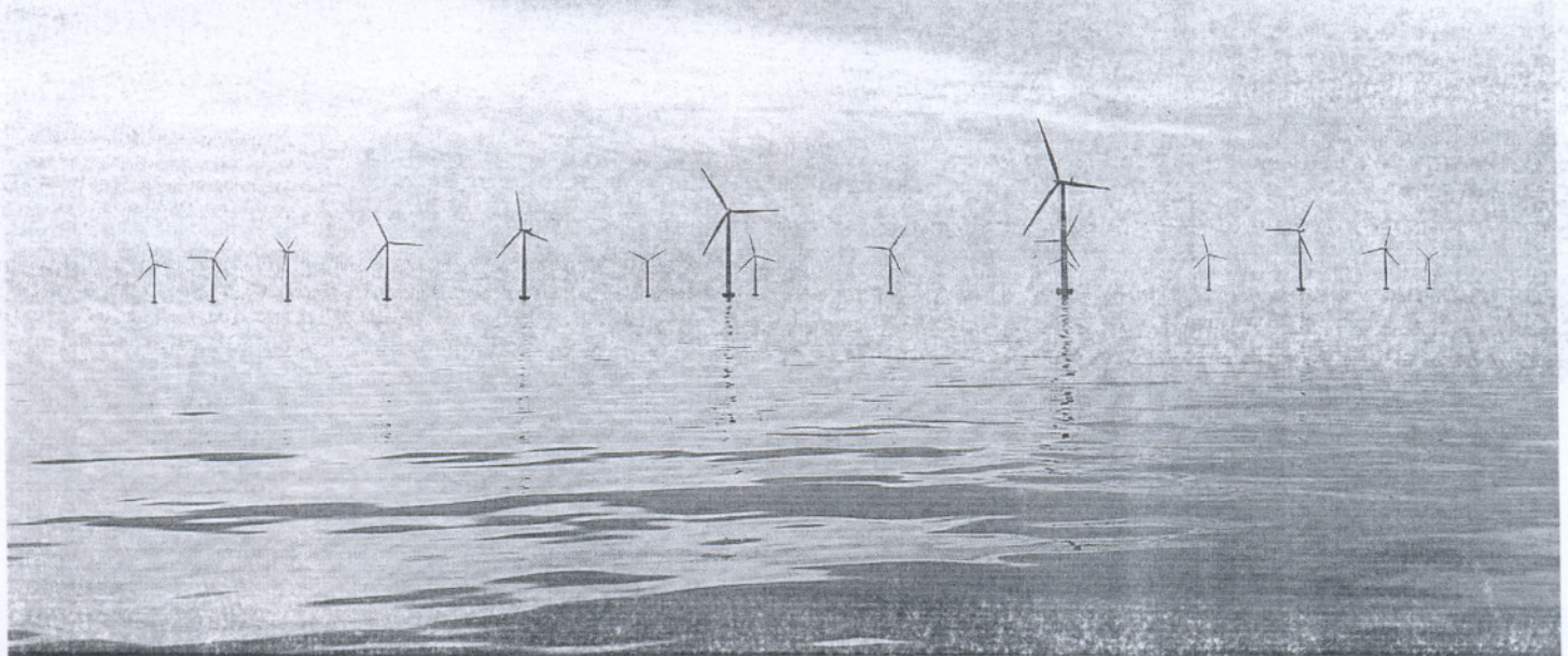
LOS PRIMEROS. Imagen de los primeros molinos eólicos instalados en el agua. Se trata de la inversión en el Mar Báltico, en Dinamarca. La carrera empezó en 1991.

En Cádiz se establece una franja de exclusión, pero se abre la puerta con restricciones