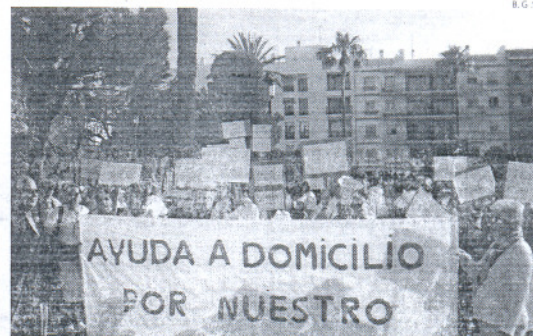
La jornada de manifestación se llevó a cabo con total normalidad.

Ayer contaron con el apoyo de representantes varios de IP, IU y PSOE, a pesar de que se hicieron escuchar bastante con distintos instrumentos que portaban para hacer ruido y llamar la atención de todos los trabajadores del Ayuntamiento y portuenses, para que conocieran la precariedad con la que trabajan.