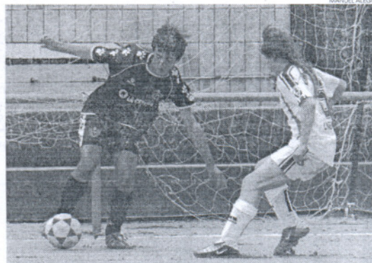
La Salle de Puerto Real perdió por la mínima (1-2) ante la PM Linense.

En el Grupo 4 también estaba todo decidido desde hacia muchas semanas con el claro dominio de la Roteña, único equipo que se ha mantenido invicto de los grupos del entorno de la Bahía gaditana. Los roteños se dieron un festín en la última jornada del Campeonato al endosarle un rotundo 8-1 al Barriada de La Playa. En este grupo se produjo además la mayor goleada del fin de semana en la categoría con el 13-1 que La Salle PSM le infringió al Trebujena. El Algaida, que empató con Los Frailes (2-2), ha sido finalmente segundo, aunque nada más y nada menos que a 16 puntos de diferencia con respecto al campeón.