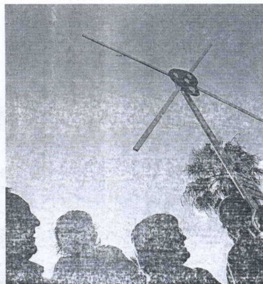
PROTESTAS. Vecinos de Barbate, durante un acto contra la implantación de las eólicas marinas.

sima densidad marítima, la profundidad del mar y la migración de especies. «El estudio corrobora la eliminación de esos 12 ó 13 kilómetros de cautela en la zona del Estrecho, aunque ya de por sí ningún proyecto lo contemplaba», destaca Daniel López. En el caso de la zona delimitada como apta con condicionantes, que va desde el Cabo Trafalgar hasta Chipiona, la restricción dependería de los efectos que las infraestructuras de los parques eólicos marinos pudieran ocasionar en la «navegación marítima, la pesca artesanal y la presencia de rutas de aves migratorias y otras especies endémicas, como el coral anaranjado». Para Ecologistas en Acción, la traba del impacto visual sería «minimizable» en el caso en el que se cumplan el resto de requisitos ya que, según subraya López, siempre estaría situado a 13 ó 14 kilómetros de la