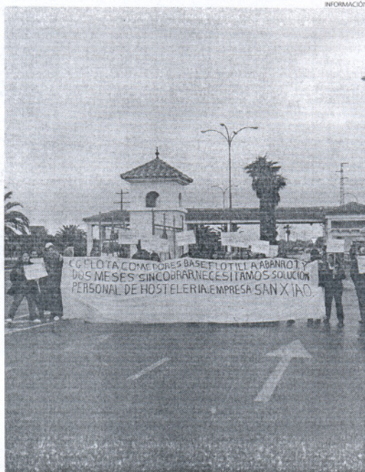
Los trabajadores de San Xiao a las puertas del control de la base naval.

Los trabajadores aseguran que, según tienen entendido, se podría hablar de una deuda contra-