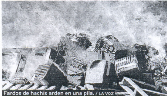
Fardos de hachís arden en una pila.

La Delegación del Gobierno en Ceuta ha trasladado cinco toneladas de resina de hachís al puerto de Algeciras para ser destruidas. La droga procede de diferentes operaciones policiales. Se trata del segundo envío del año después de que se suspendieran las incineraciones en Ceuta por motivos medioambientales.