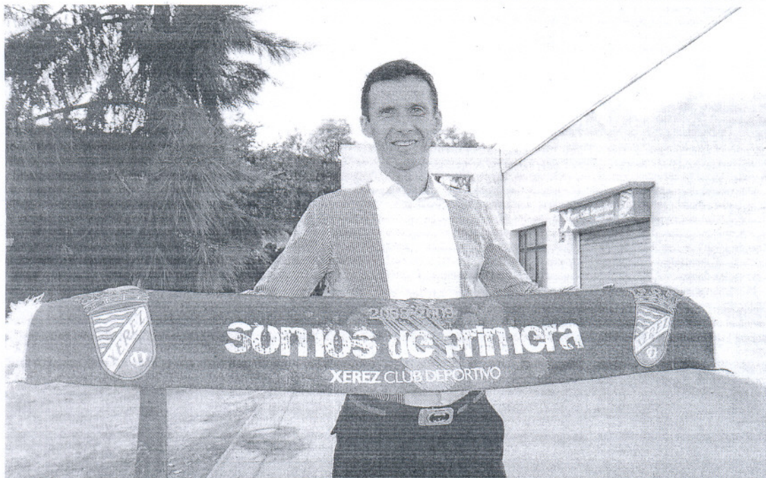
OFICIAL. El navarro firmó ayer su compromiso en las oficinas del club y después posó así de satisfecho ante los medios.