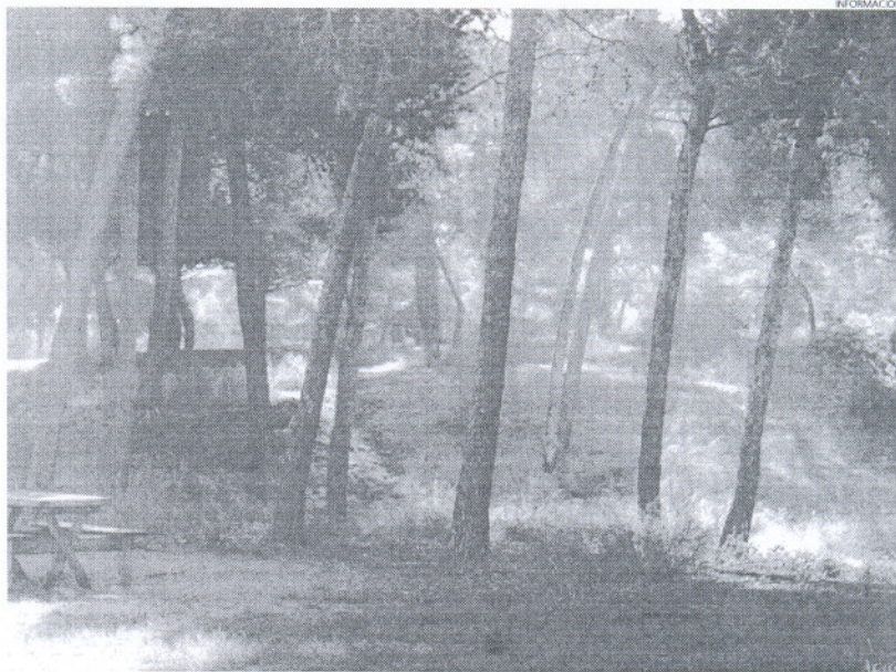
Los pinares cercanos a la playa fueron el escenario de algunas de las agresiones perpetradas por el detenido.

Tras denuncia interpuesta por M.M.S.R. el pasado día 20 de junio de 2009 por abuso sexual sufrida en la playa de Piedras Gordas el pasado día 27 de junio, se logró identificar al agresor, y de entre las denuncias conocidas des-