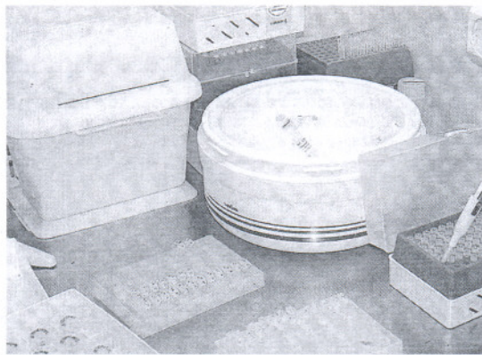
LA CLAVE. Una muestra de ADN, analizada en el laboratorio.