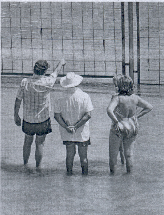
BAÑISTAS. En la playa del Chorrillo junto a la valla. / c.o.

El ecologista también resaltó la ubicación de la playa de El Almirante, que se encuentra en pleno casco urbano de la ciudad. «Otras playas militares están totalmente delimitadas, pero ésta apenas tiene una valla y esa zona está en creciente expansión». A su juicio «no tiene sentido mantener vallada una parte de la costa cuando no se le da uso alguno más allá del recreo de los militares».