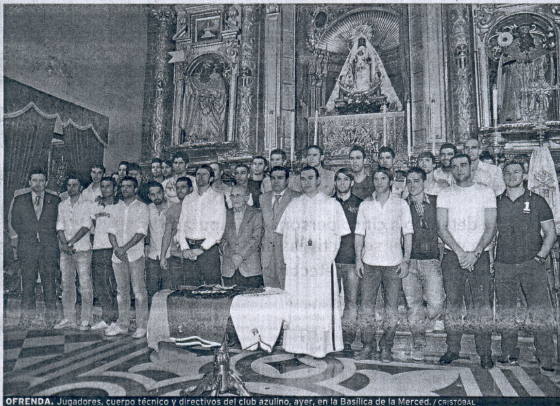
OFRENDA. Jugadores, cuerpo técnico y directivos del club azulino, ayer, en la Basílica de la Merced.

El Xerez ofrece a la Virgen de la Merced la copa de campeón de Segunda División