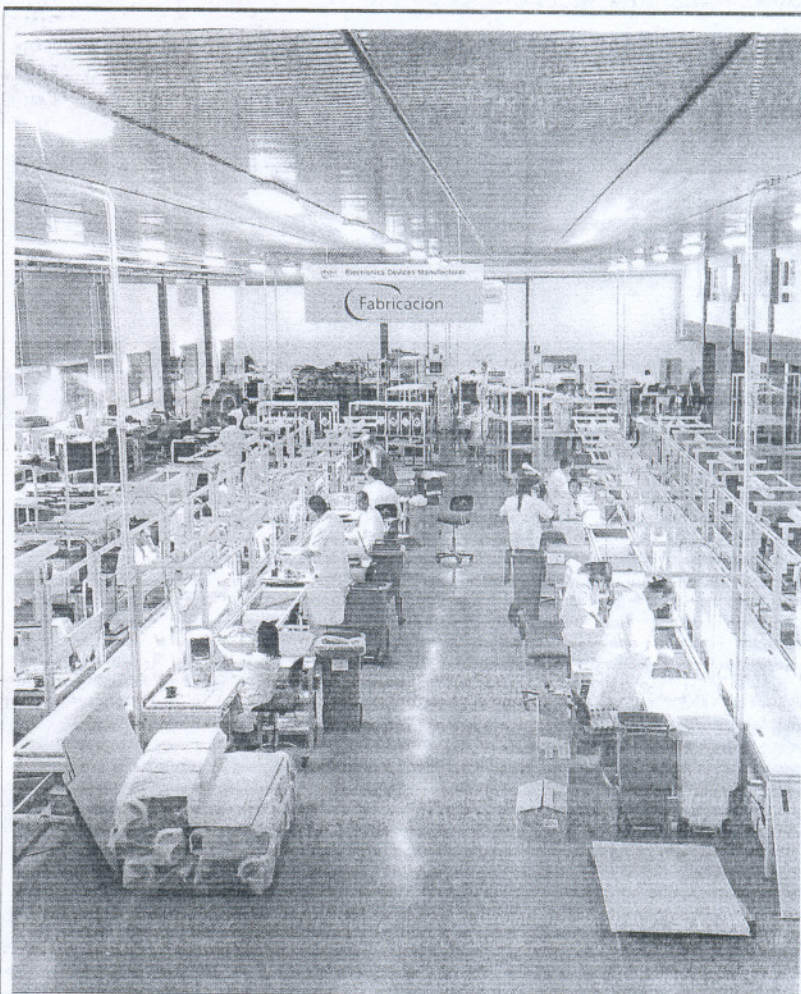
Trabajadores de la cadena de montaje de EDM Electronics en Jaén.

Tras la reunión del Consejo de Ministros, la vicepresidenta primera, María Teresa Fernández de la Vega, también valoró de forma "positiva" la nueva bajada de precios y reiteró que el Ejecutivo "no contempla" la deflación. El secretario de Economía del PP, Álvaro Nadal, opinó que la economía española "nunca ha estado en una situación de contracción de su actividad y disminución de ventas" como la actual, y dijo que el "descenso brusco" de la inflación coloca a España "en la antelana de un proceso deflacionista".