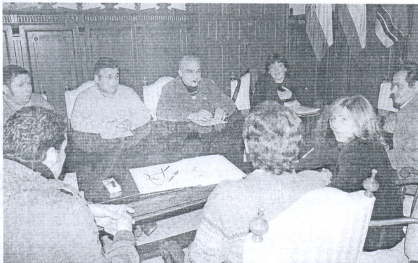
Un momento de la reunión de la alcaldesa con la asociación de comerciantes del Mercado de Abastos.