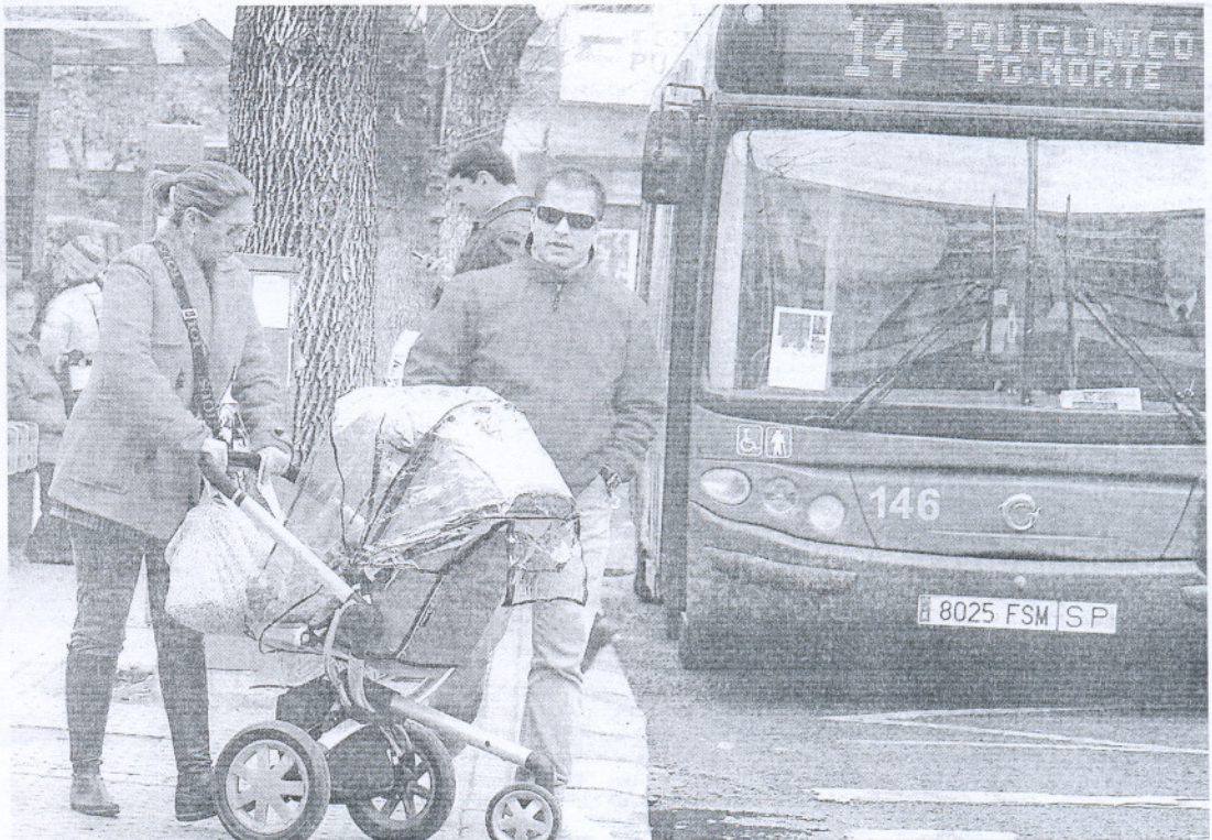
Una mujer con un bebé en un carrito espera para acceder a un autobús urbano.

Al tratarse de un "problema real, que genera situaciones conflictivas y de inseguridad afectantes a personas menores de edad", e intuir que los estados miembros de la UE no iban a abordar el asunto, la institución se dirigió al Defensor del Pueblo Europeo, Nikiforos Diamandouros. Al homólogo europeo le pidió información sobre quejas en otros territorios, le propuso modificar la directiva europea que se aplica al transporte público y le sugirió que se instase a la Comisión Europea a elaborar una directiva para regular esta cuestión.