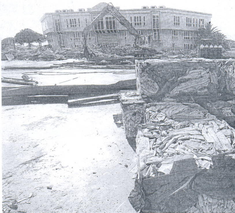
El edificio de la antigua sede de Transportes Carrillo, en Puerto Real, será gestionado por Gadir Solar.

Hay que recordar que desde Gadir Solar ya se anunció que su