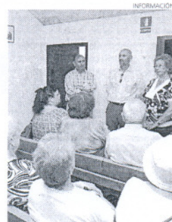
La clausura era en el mismo centro.

diferente, abordando distintos aspectos sobre la flora y vegetación autóctonas. Para Corrales, uno de los objetivos era dar a conocer el Centro de la Mayetería a las personas mayores de Rota.