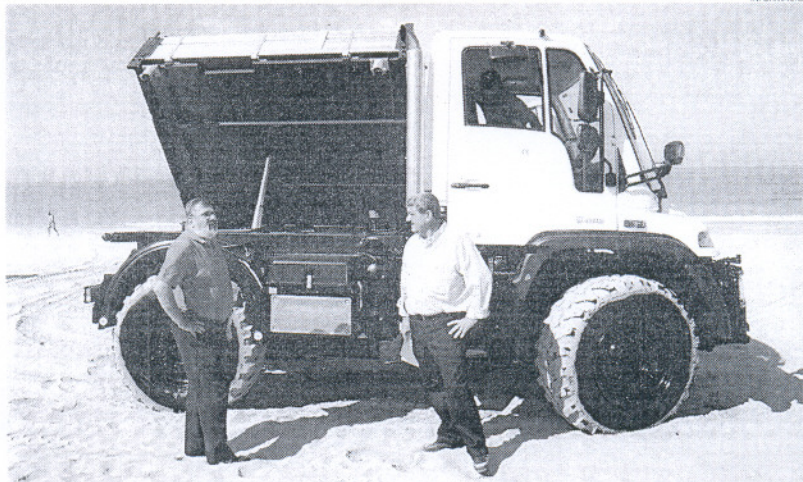
Los responsables de Playas presenciaron las habilidades de este nuevo camión multiuso sobre el terreno.