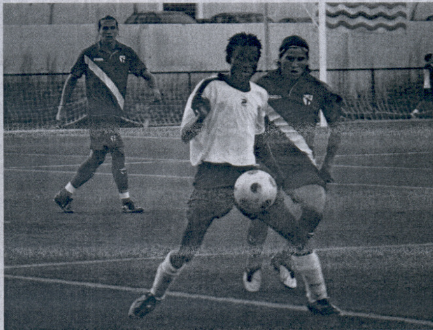
El San Fernando CD ha transmitido muy buenas sensaciones durante esta pretemporada.

Un total de 18 equipos -once de Cádiz y siete de Huelva- componen esta temporada el grupo 1 de la Primera Andaluza. San Fernando CD, Conil, Arcos y Chiclana CF parecen, a priori, los rivales a batir