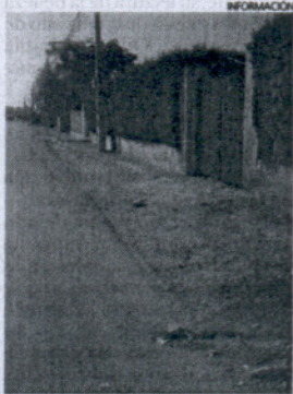
Parte de las actuaciones.

La intención es que la suciedad no se acumule en los recovecos de calles o carreteras, puesto que es un lugar de mucho tránsito que necesita un cuidado y una mejora constantes para que los vecinos no corran peligro por incendios o similares.