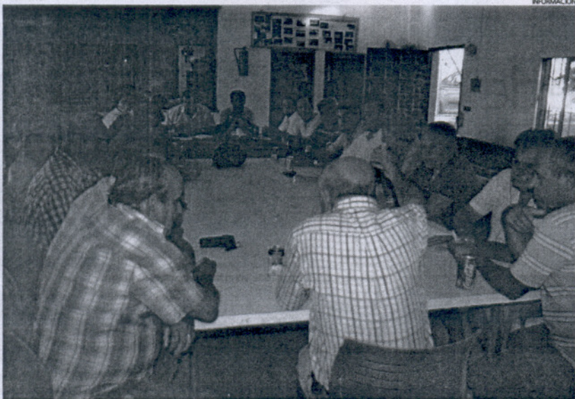
Los 23 presidentes de diseminados asociados reunidos en el local cedido por La Andreita.