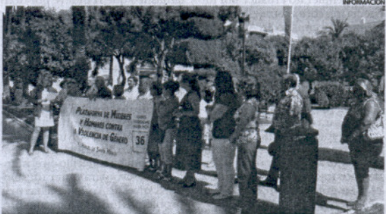
La manifestación de ayer en la plaza del Polvorista.