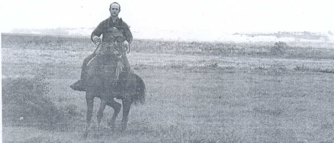
El paraje de Malcucaña, en Vejer, se verá afectado por la construcción del complejo.