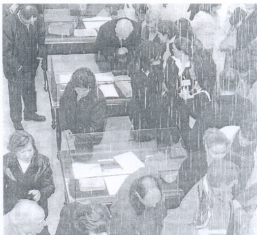
Muchos visitantes en la exposición del archivo municipal.

En este mismo lugar el alcalde y autoridades abrieron al público la exposición del 'Legado Documental del Archivo Histórico', donde en varias vitrinas de cristal se exponen documentos o cartas dispositivas desde los siglos XIII al XX y prensa escrita provincial y local. Entre ellos destaca el Privilegio rodado de Alfonso X 'El Sabio' por el que se concede a los pobladores de Medina exenciones y franquicias. Es el documento más antiguo que se conserva en el archivo y data de 1267. También se muestran otros documentos como el primer libro impreso que se conserva allí, de 1670.