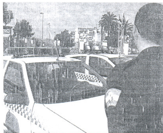
Los sindicatos se quejan de las continuas averías en los vehículos.

Sendos órganos sindicales, compuestos por CCOO y UGT, criticaron que "el pésimo estado" de tales instalaciones "se agrava enormemente en épocas de lluvias, cuando se producen inundaciones y rebosan los orines y excrementos en los aseos". De acuerdo con su versión, "la instalación eléctrica y el sistema informático sufren cortes frecuentes, lo cual,