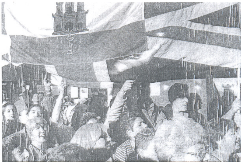
Un grupo de gibraltareños, durante el referéndum de 2002 sobre la soberanía compartida.

El Gobierno de Caruana volvió a insistir ayer en la importancia del referéndum e hizo un llamamiento a los gibraltareños para que di-