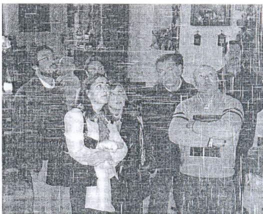
La diputada y la delegada provincial durante su visita de ayer.

La primera fase del proyecto de restauración tiene un coste aproximado de 27.000 euros y un tiempo estimado de ejecución de cuatro meses. Esta fase es la más urgente de realizar, ya que en ella se llevaría a cabo la sujeción del