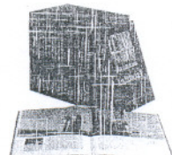
DESCUBRIR LA PENÍNSULA Cada domingo por solo 10,95 €

La entrega de pergaminos comenzaba con aquellos funcionarios que han cumplido veinte años al servicio del Ayuntamiento, por lo que recibieron su correspondiente reconocimiento un total de diecisiete funcionarios. Seguidamente, se entregaron los premios a los siete funcionarios que llevan treinta años trabajando en este Consistorio. Y finalmente, se hizo entrega de una placa y un pergamino a los funcionarios jubilados este año.