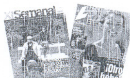
XL SEMANAL Y LECTURAS Todos los domingos