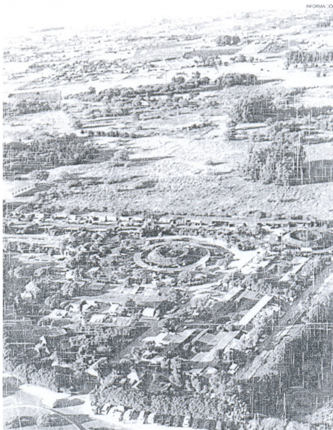
El futuro hotelero de la localidad está en estos terrenos, ubicados en el Sup R-8.

El equipo de Gobierno persigue convertir la ciudad en un referente a nivel turístico y formativo.