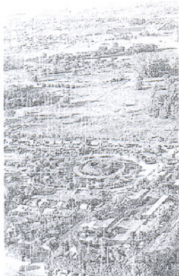
Vista aérea del camping.