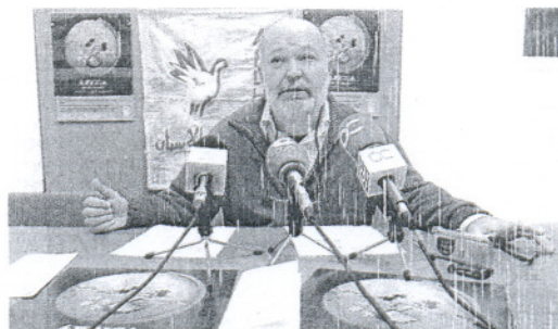
CRÍTICO. Lara durante la rueda de prensa de ayer.

Las posibles causas de esta situación en la provincia, según