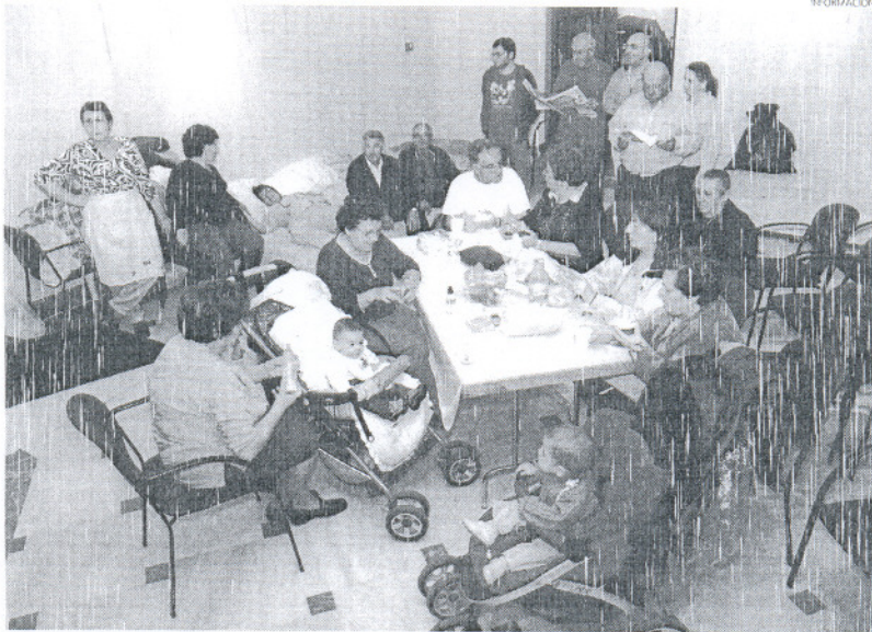
Los ex trabajadores de Concurso cumplen hoy 36 días de encierro en las dependencias municipales.

Por otro lado, la portavoz salió al paso de un comunicado publicado el pasado día 5 de diciembre en la página web de la UGT. El contenido del documento, según Rosa Caballero, es querrelable al acusar a los ex trabajadores de "crear confusión y falsas expecta-