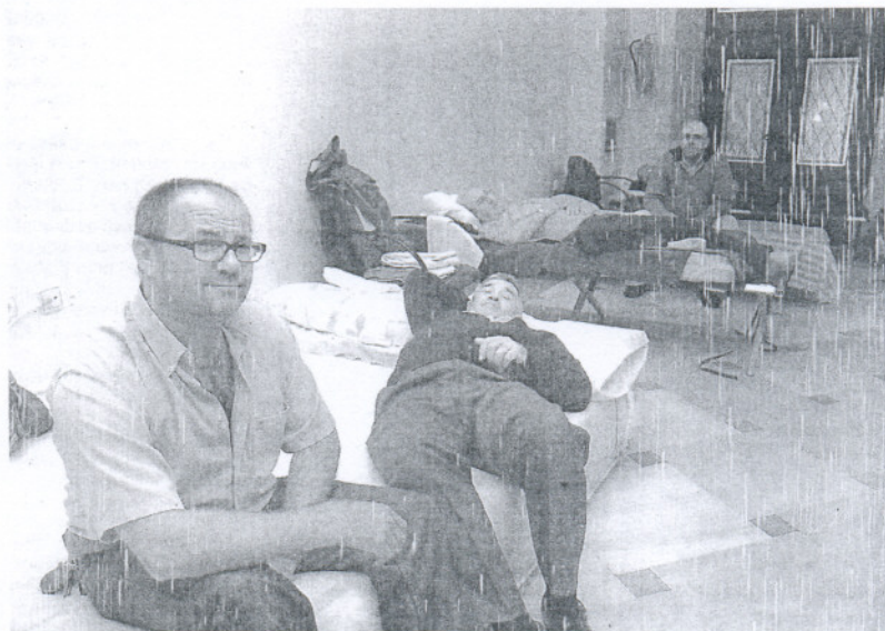
El colectivo mantiene un encierro indefinido en el Consistorio desde hace 35 días.

Por su parte, la iniciativa de IULV-CA, va más allá y demanda a la Administración Autonómica que, además de «mostrar su apoyo y solidaridad» a los empleados, «arbitre las medidas oportunas para evitar que los embargos planteados incidan negativamente en sus economías