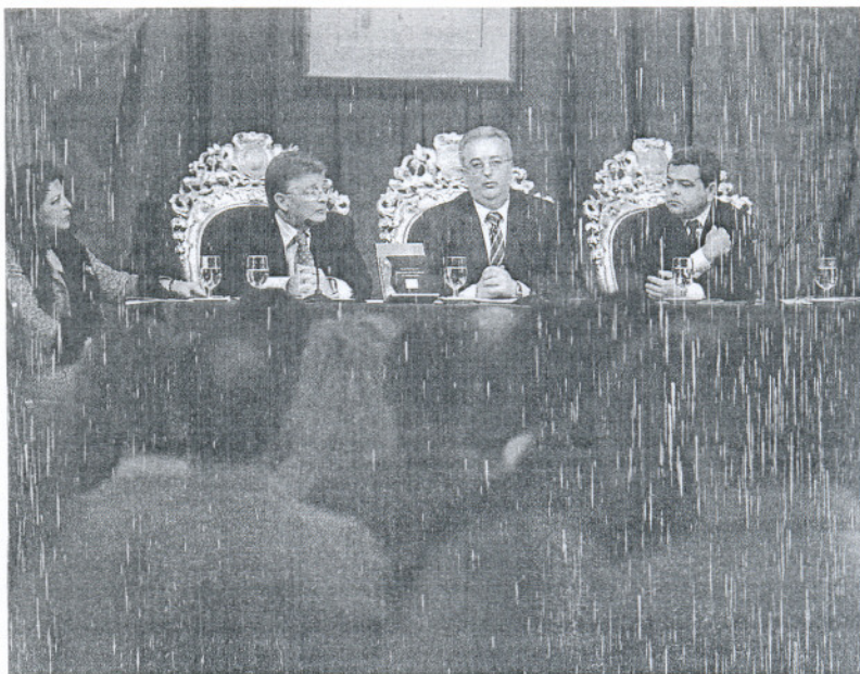
Los nuevos emprendedores llenaron el Salón Regio de Diputación en un acto que presidió el consejero de Empleo. JESUS MARIN

Entre las iniciativas más novedosas, la Junta destacó una de ellas que formará a 30 alumnos en