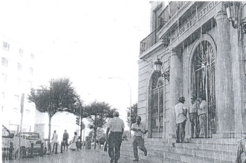
JUSTICIA. El juicio tuvo lugar en la Sección Cuarta de la Audiencia Provincial.

Según el letrado, la orden de alejamiento quedó sin efecto en