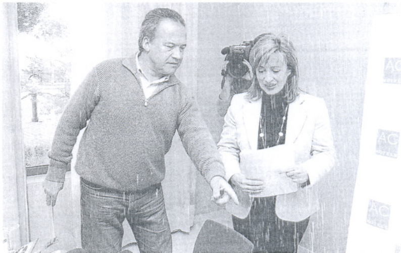
El informe de la Cámara de Cuentas no deja en buen lugar a la gestión municipal del PSOE y sus socios en Jerez.

Con respecto a los otros siete ayuntamientos gaditanos con más de 50.000 habitantes, destaca el caso de El Puerto, que la Cámara de Cuentas sitúa como el tercer consistorio andaluz con mayor