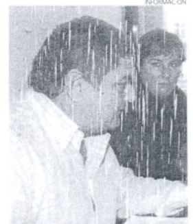
Pedro Custodio, líder de UGT.

Precisamente, la plataforma integrada por todos los partidos políticos de Rota, con y sin representación municipal, -PP, Roteños Unidos, PSOE, AIRE, PSA e IU- y creada para apoyar a los ex trabajadores de Conpursa, consideró ayer que hay "falta de respues-