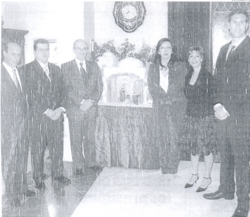
Corrales recibió en el Castillo de Luna a los Reyes Magos, el Cartero Real y la Estrella de la Ilusión.

NAVIDAD El encuentro sirvió para presentar a los Reyes Magos