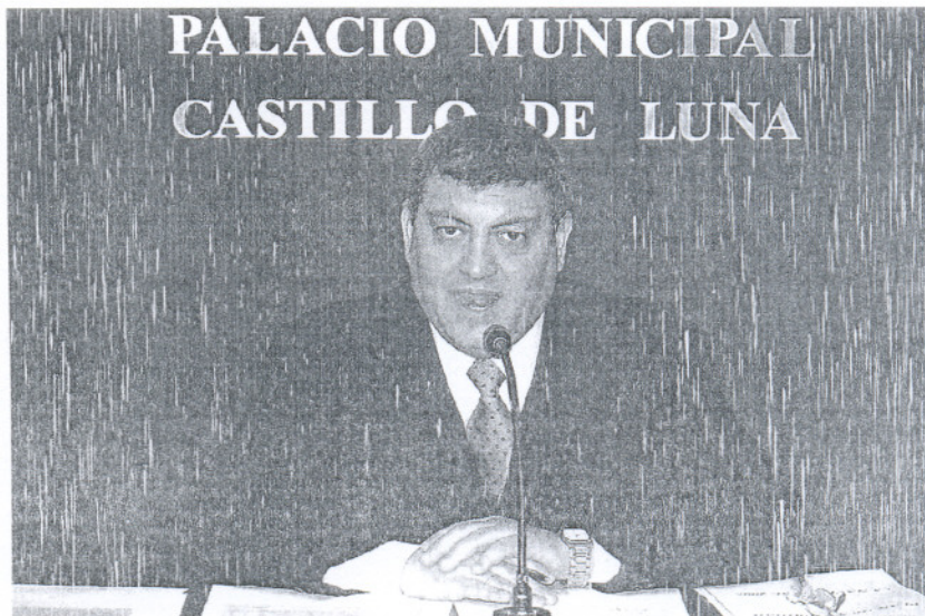
SATISFACCIÓN. Alcedo manifestó ayer la alegría del equipo de Gobierno ante la noticia.

Teniendo en cuenta los plazos de ejecución del mismo, Alcedo