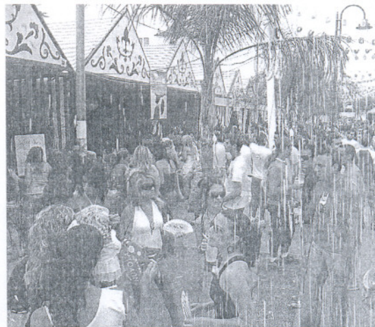
La Policía sólo actuó en la localidad durante la Feria. / P. A.

De todas formas, desde el Ayuntamiento se dirigirán a la Junta de Andalucía para que refuerce la seguridad en Sanlúcar por medio de la Policía Autonómica, «que es la competente en materia de consumo de alcohol por parte de menores de edad, porque a Sanlúcar sólo han venido agentes autonómicos dos días en la Feria de la Manzanilla en este año 2006». Asimismo, se solicitará a la Junta que colabore con los gastos que se puedan derivar