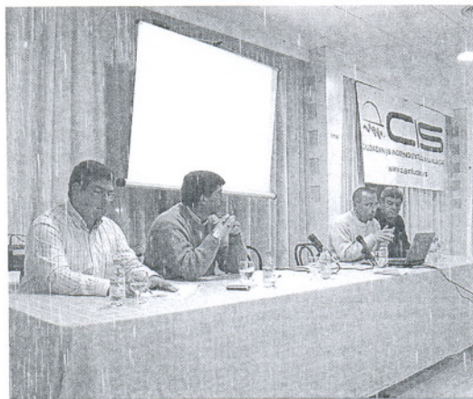
Imagen del encuentro sobre este materia que CISanlúcar organizó esta semana.

En cuanto a las instalaciones deportivas, opina que "la escasez de medios para mantener las existentes y la falta de personal está permitiendo, ante la pasividad del equipo de Gobierno, que muchas de ellas no puedan ser utilizadas o que el grado de deterioro sea tan enorme que el coste de sus reparaciones sea muy superior a lo que realmente hubiera costado mantenerlas en buenas condiciones". Desde su punto de vista, "un solo técnico de mantenimiento y tres conserjes para ocho instalaciones públicas es totalmente insuficiente", aparte de "la falta de control municipal en las pistas de las barriadas, con los riesgos que ello supone para los usuarios".