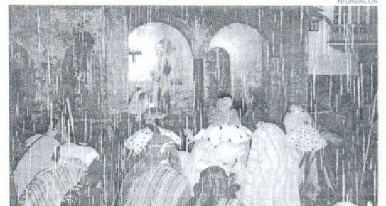
Este año vuelve a celebrarse el Belén viviente.

El fin de semana previo a la Navidad comenzará el viernes 22 con el tradicional Concierto de Navidad, en la Parroquia, a las 20.15 horas, en el que actuarán el Orfeón Virgen de la Escalera y la Escolanía Caracola. Al día siguiente