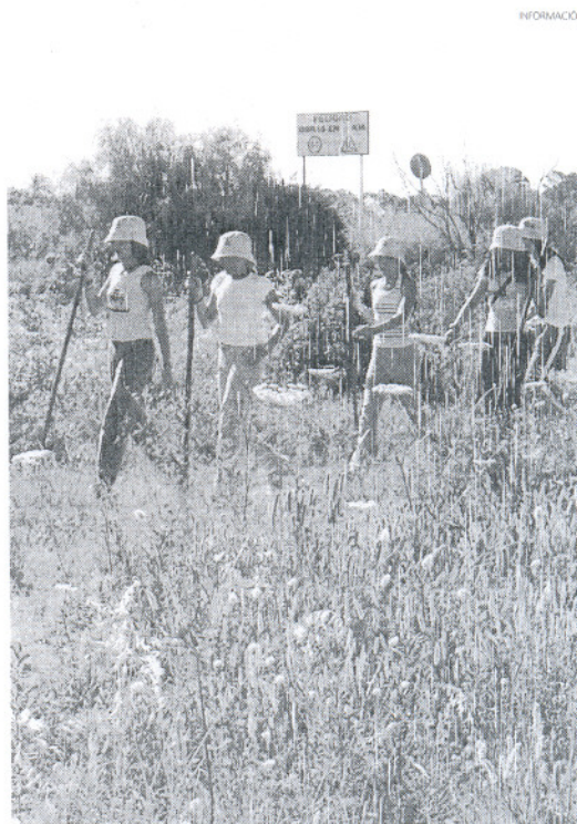
La Vía tendrá 7,5 kilómetros de largo y seis metros de ancho.