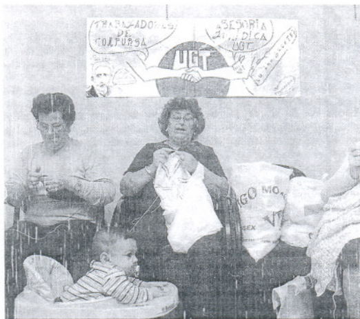
Los familiares de los ex trabajadores también participan en el encierro.