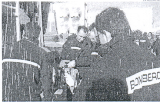
Un total de 28 vehículos fueron presentados ayer por la mañana.

Los vehículos presentados ayer, al igual que los que conforman el parque provincial, han sido dise-