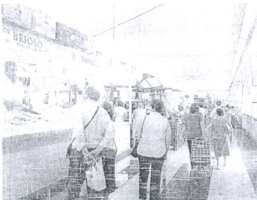
La plaza de Abastos sanluqueña en una imagen de archivo.

Este colectivo destaca que dicho plan "duplica su presupuesto destinado, principalmente, a la reactivación económica de los centros urbanos, por lo que instamos al Gobierno municipal a tramitar los expedientes necesarios y a llevar a cabo las inversiones precisas para modernizar el Mercado de Abastos, motor económico del centro de la ciudad". A este respecto, ha explicado que "la reforma del Mercado requiere explícitamente la obligato-