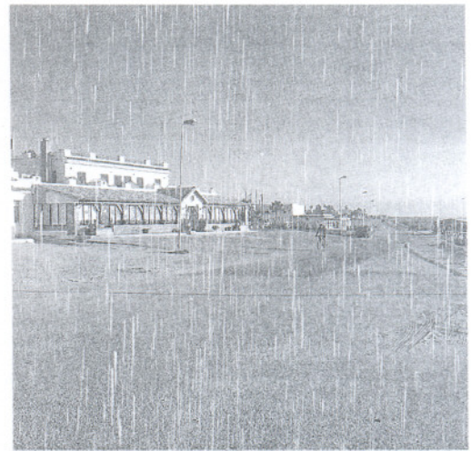
PRIMERA LÍNEA. La carretera principal desaparecerá.

En cuanto a los costes que supondrá para el Ayuntamiento poner en marcha la ejecución del PERI, el primer edil señala que «nosotros ya contratamos a un