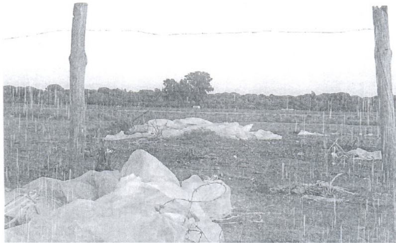
DEJADEZ. Estado actual de abandono que sufren las marismas y el Pinar de La Algaida

Según afirmó la oenegé mediante el citado comunicado, más de 500 cabezas de ganado transitan sin control por el lugar «sin que las consejerías de Agricultura y Medio Ambiente ni Demarcación de Costas quieran atajar este asunto, obligando a los propietarios a llevarse las fuera del parque». «La carga ganadera está ocasionando desde hace años verdaderos estragos en las marismas del Guadalquivir y en el pinar de La Algaida», denuncian.