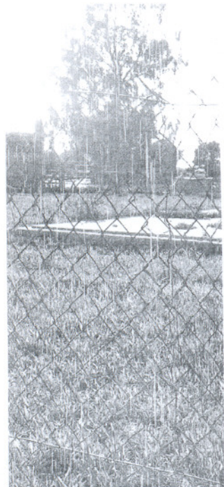
DEMOLICIÓN. La parcela de la última viv

judiciales. Jueces y fiscales son quienes toman la iniciativa sobre los asuntos a investigar; siendo su punto de partida la denuncia de las administraciones autonómica (consejerías de Obras Públicas y Medio Ambiente) y local o particulares, y a su requerimiento, esta unidad emprende sus pesquisas. El rastreo en registros de propiedad y escrituras notariales, inspecciones, reportajes fotográficos