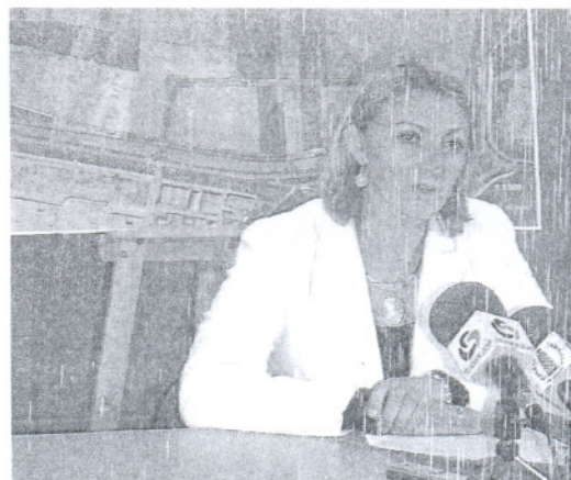
La alcaldesa ofreció ayer una rueda de prensa.

Al mismo tiempo, la alcaldesa ha dado orden al presidente de la Gerencia Municipal de Urbanismo para que de forma inmediata se ponga en contacto con los propietarios del suelo para iniciar los trámites, ya sea por la vía de la expropiación o a través de agentes urbanísticos, «para que de esta forma, cuanto