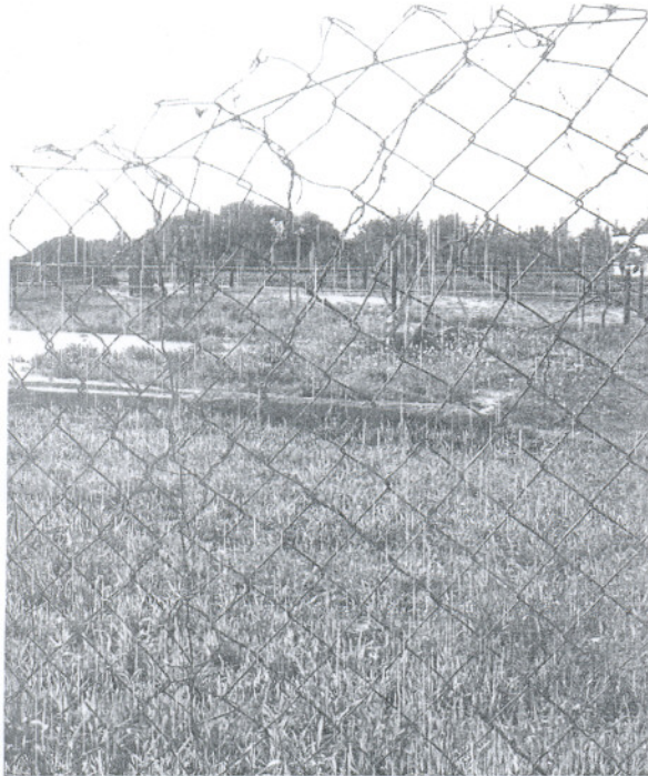
nda irregular derribada por Urbanismo en La Guareña, en 2003.