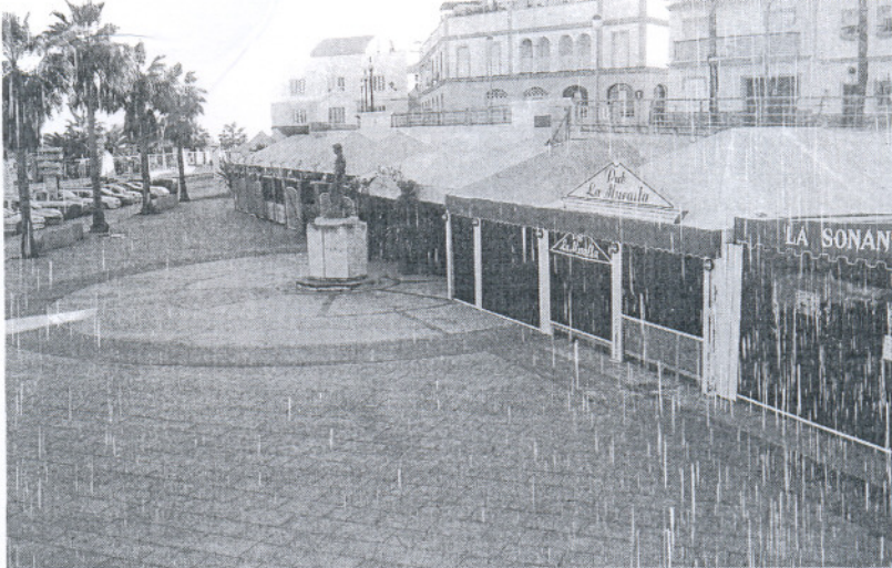
La avenida San Juan de Puerto Rico es la zona en la que más jóvenes se concentran los fines de semana.

A efectos de la Ley, "redactada y aprobada en el Parlamento an-