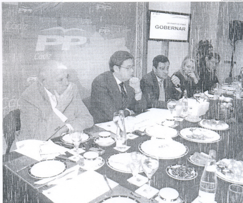
Miembros de la Ejecutiva provincial del PP, en el desayuno de ayer con los medios de comunicación.

Asimismo, el popular recordó las "irregularidades" de los convenios urbanísticos de Jimena de la Frontera y en fincas de El Bosque como El Imperio, así como "acuerdos extraños" en Alcalá del valle. Así las cosas, aseguró que "estamos es-