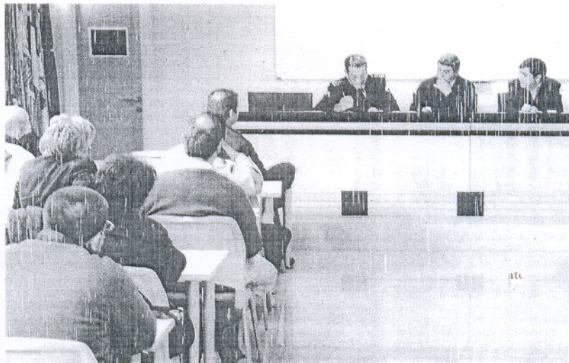
APRENDIZAJE. La policía está recibiendo cursos de formación sobre la nueva ley

Asimismo, el responsable municipal anunció la próxima creación de una Comisión formada por Medio Ambiente, junto con Participación Ciudadana, así como todas las partes implicadas, para buscar alternativas, aunque el delegado se mostró escéptico a la hora de abordar la Ley Antibotellón apuntado que