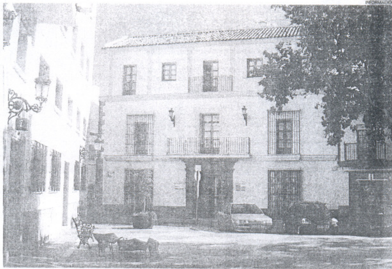
La Oficina Municipal de Fomento Económico ofrece más información sobre estas subvenciones.

El plazo de presentación de solicitudes estará abierto durante este mes de enero para todas las contrataciones de carácter indefinido y transformaciones de contratos de duración determinada en indefinidos formalizados en-