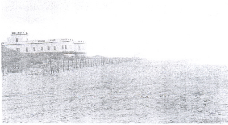
ESCENARIO. En esta zona del litoral, cercana a la playa de Regla, tuvo lugar el trágico incidente.

El caso a pasado a manos de la Guardia Civil que se encargará de