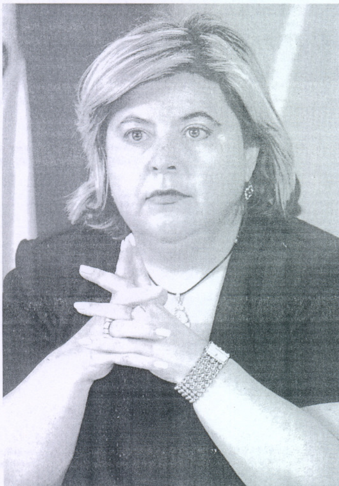
La consejera de Gobernación, Clara Aguilera, quiere que los municipios estén en el debate.

la necesidad de articular una nueva Ley de Régimen Local y un nuevo marco de financiación para los municipios. Por Carmen del Toro