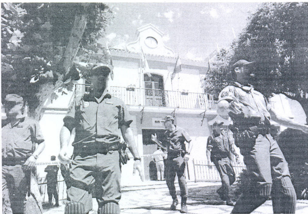
La imagen del Ayuntamiento de Estepona custodiado por la Policía refleja parte del problema de la financiación a través del urbanismo.