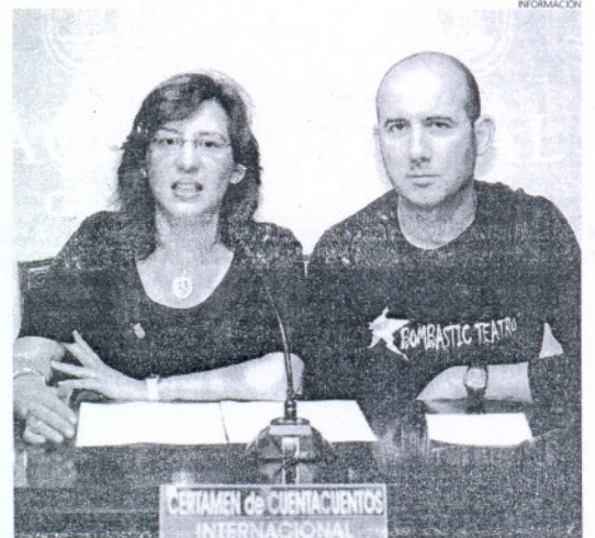
El Festival trata de promocionar el arte de la narración oral o cuentería.