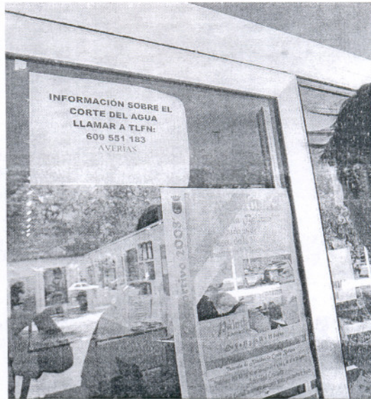
El teléfono de averías, en la tenencia de Alcaldía de Costa Ballena.

Rota, localidad turística por excelencia de la costa gaditana, duplica su población durante los meses de la temporada estival con la llegada de miles de visitantes. Esto significa que también se genera en verano el doble de residuos. El servicio de recogida de basuras cuenta con cerca de 70 trabajadores.