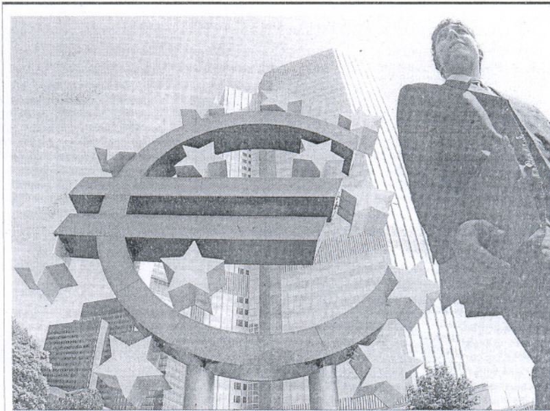
Un ejecutivo alemán pasea ante el símbolo de la moneda única europea.

Según una encuesta publicada ayer por el BCE y que se realizó entre junio y julio, el endurecimiento de las condiciones para conceder créditos a empresas se produce por el deterioro de las expectativas económicas y es más pronunciado en los préstamos a largo plazo que a corto, lo que afecta de manera especial al tejido empresarial español por su nivel alto de dependencia a la financiación exterior a la que alude el Banco de España.