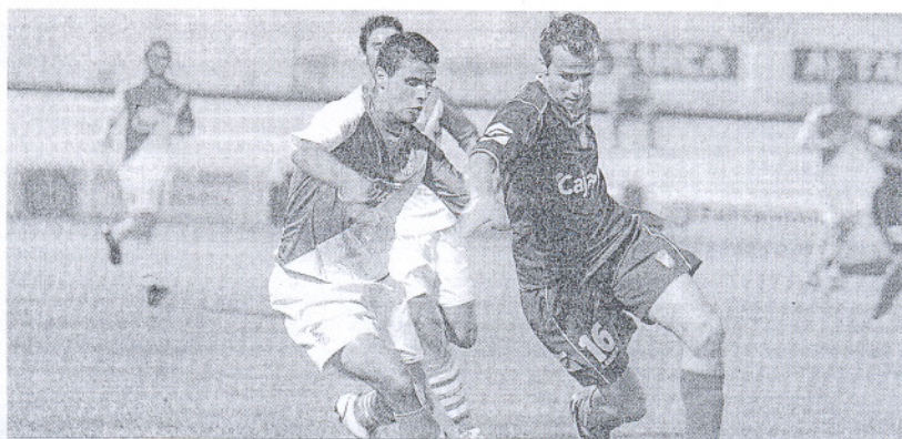
Verdiblanco y azulino cerraron el torneo con un último partido determinante.

Por contra, el Xerez mejoró su imagen en el último choque ante los locales. El conjunto de Esteban Vigo se mostró mucho más vertical y rápido en sus combinaciones y pronto perforó la portería defendida por Bocardó. El Puerto Real no encontró su sitio y eso lo aprovechó el conjunto xerezista para sentenciar con el 3-0.