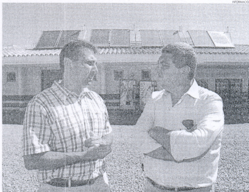
El polideportivo de Costa Ballena no es la única instalación municipal que cuenta con este sistema de energía.