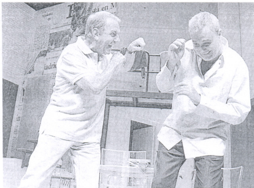
Muchos han sido los actores que han interpretado la obra de Neil Simon, La extraña pareja .