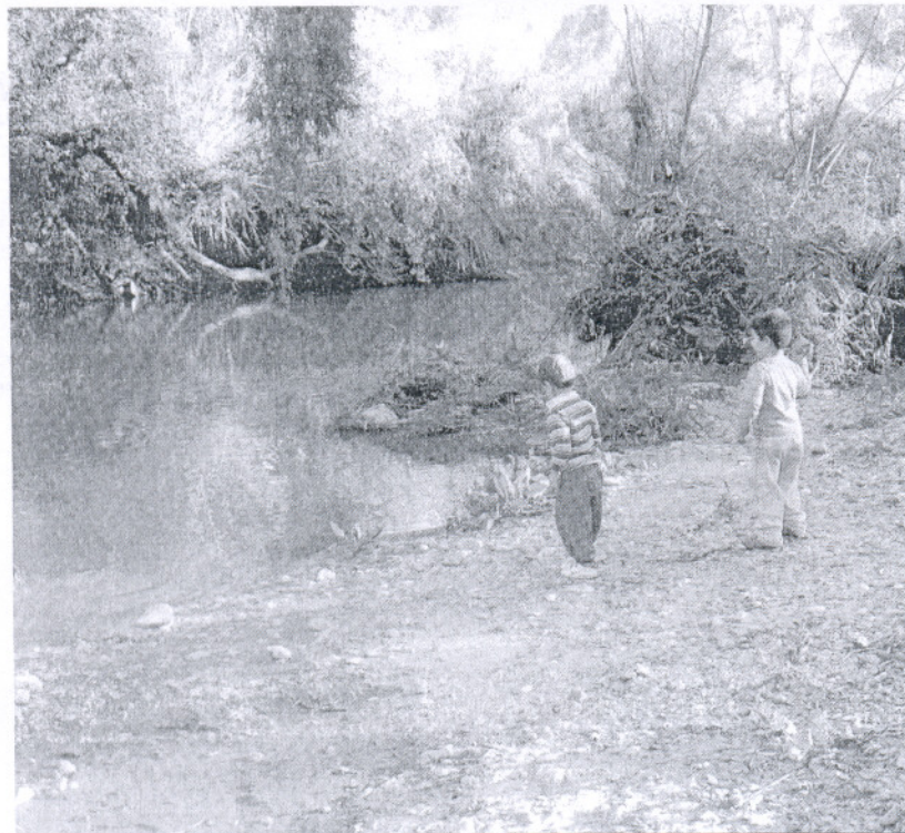
Niños juegan en el cauce del Guadiaro.