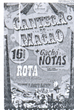
Imagen del cartel del concierto.

Cantecca de Macao, que en algo más de tres años ha pasado de tocar en las calles madrileñas a los escenarios de algunos de los fes-