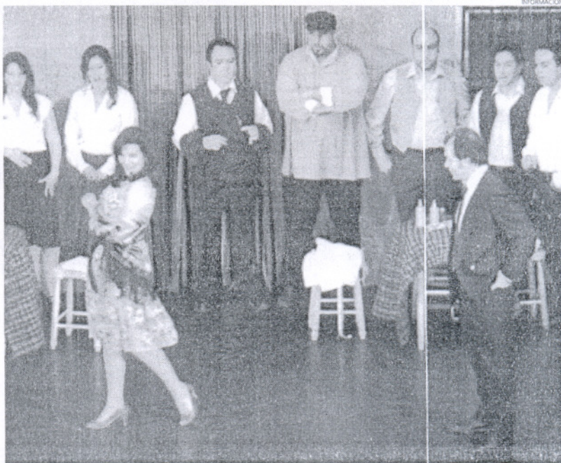
La Compañía de Teatro Lírico Andalúz pondrá en escena la zarzuela 'Los Claveles', un gran éxito del género.

Para concluir, el delegado recordó que la taquilla del teatro