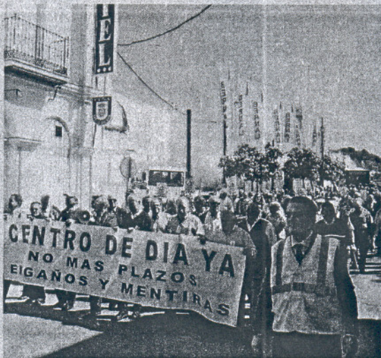
PANCARTA. Los manifestantes al final del Paseo de Andalucía.