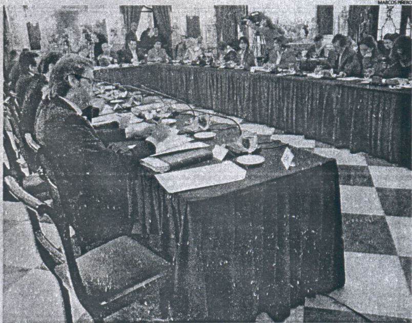
En la imagen, el escaño vacío de Loiza (PP) que abandona su cargo de diputado para centrarse en el Parlamento.

La Corporación provincial También fue aprobado el Manifiesto de conmemoración del Día Internacional de las Mujeres, que contó con el voto en contra del PP al considerar que el documento era "sectario" por ser "una loa" a la Ley contra la Violencia hacia las Mujeres, que aprobó el Gobierno del PSOE.