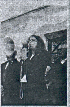
La delegada de Asuntos Sociales en la manifestación.

El Ayuntamiento arcense también está concluyendo el Centro de Día del Barrio Bajo y ha habilitado un local, en la calle Picaso, para la Asociación de Jubilados de Las Canteras. sierra@lavozdigital.es