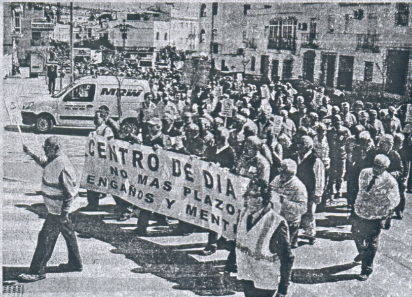
Los mayores recorrieron las calles de Arcos ayer en forma de protesta.