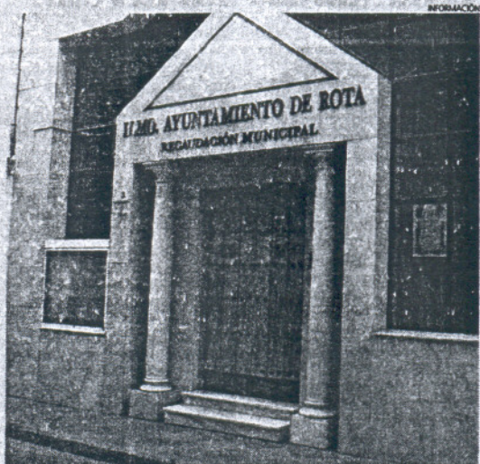
La delegada solicitó a los contribuyentes interés por este calendario.

Estos impuestos municipales se pueden abonar, tal y como se recoge en el documento, en Caja Sur, el Banco de Andalucía, el Banco Bilbao Vizcaya, la Caja Rural del Sur, la Caixa, Caixa Catalunya, Banesto, el BSCH y Caja Granada. "Hemos de cumplir con nuestro deber cívico de pagar los impuestos", pidió la delegada.