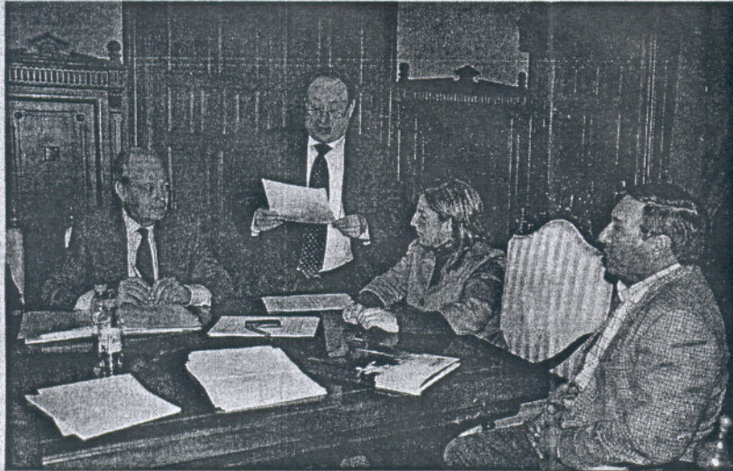
Reunión celebrada ayer en la que se firmó la adjudicación de las obras a la empresa Avisur.

El Consistorio asegura que, junto a 2.000 columbarios, cubrirán las necesidades de la población en los próximos 15 años