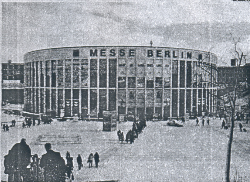
La localidad, al igual que otros años, ha conseguido obtener interesantes contactos en la feria alemana.

A estas empresas se han sumado los hoteles que se ubican en Costa Ballena y que estuvieron representados en los expositores