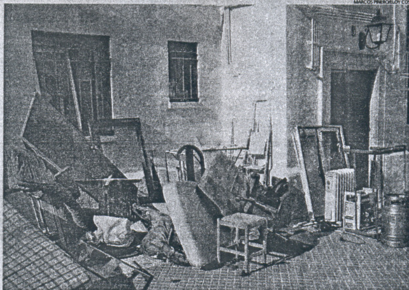
Los bomberos tuvieron que sacar numerosos enseres para facilitar las labores de extinción.

Según informaron a este medio fuentes del Servicio de Emergencia 112 y del Consorcio de Bomberos de Cádiz, los hechos tuvieron lugar el martes sobre las 23 horas cuando se recibió el aviso de un incendio en una vivienda, ubicada en un bajo del número 2 de la calle Carraca del barrio de Puntales. El fuego se localizó en el salón, donde los bomberos encontraron una placa eléctrica para cocinar sobre una repisa. Los dos ocupantes de la vivienda resultaron afectados, uno