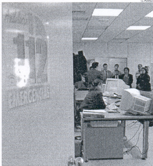
El 112 ha recibido más de 265.000 llamadas en toda Andalucía.