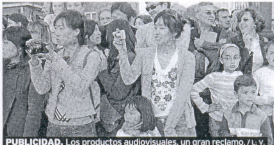
PUBLICIDAD. Los productos audiovisuales, un gran reclamo.

je del programa, un equipo de nueve profesionales recorrerá las provincias de Málaga, Granada y Cádiz del 23 al 27 de marzo y del 13 al 17 de abril. La grabación se hará en dos viajes promocionales en cuya organización colabora la Consejería de Turismo, Comercio y Deporte de la Junta. Conocerán de este modo la oferta de ocio y de sol y playa de la Costa del Sol, el municipio de Tarifa y en Granada.