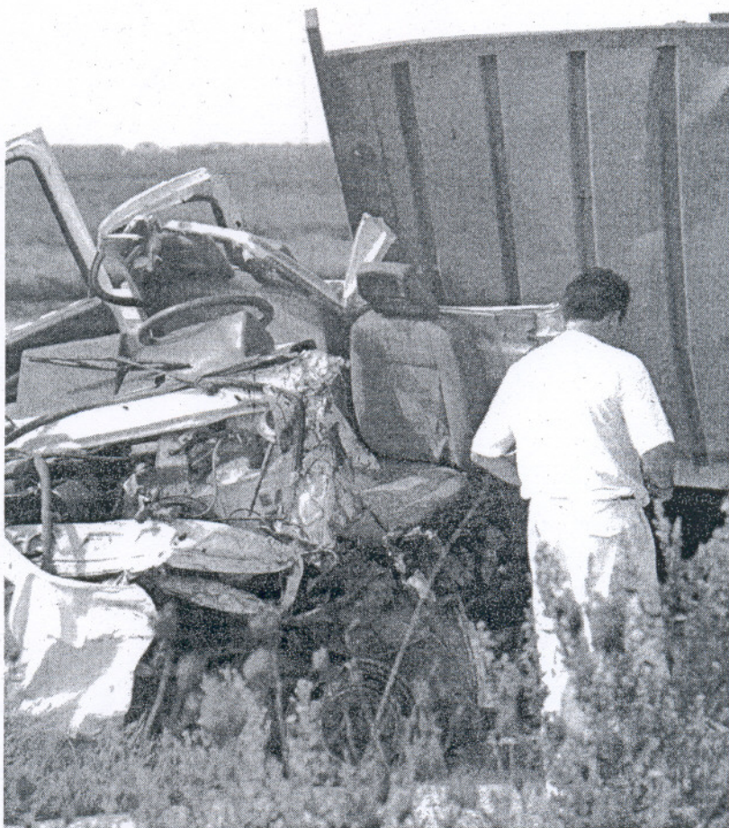
El carné por puntos y la reforma del Código Penal en materia de seguridad vial, posibles causas del descenso.

Hasta las 00.00 horas de ayer, y a falta de cerrar la operación