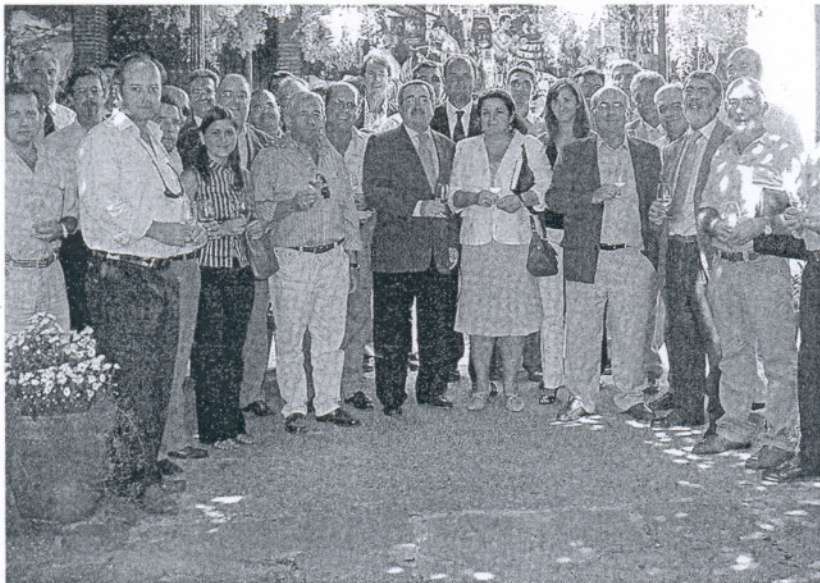
Integrantes de Arjeman en la pasada asamblea.