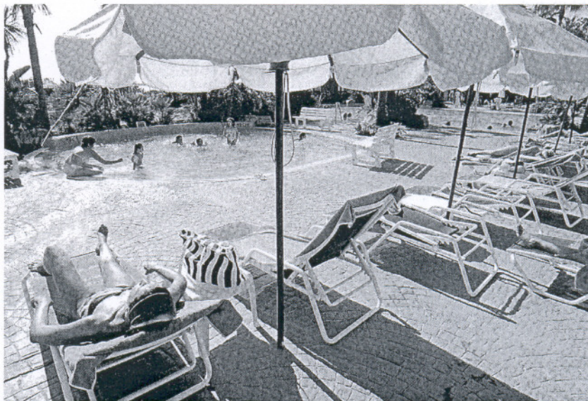
LUJO. Los viajeros rusos buscan destinos de calidad, a la altura de su gran poder adquisitivo.

Hasta ahora el número total de viajeros procedentes de aquel país