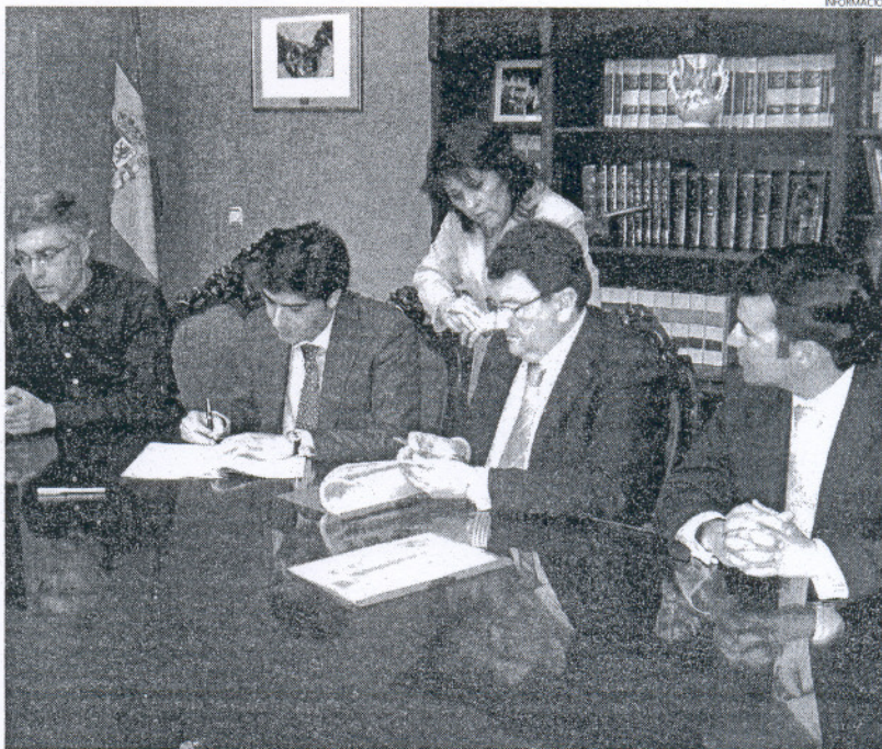
El alcalde y representantes de Tentusol, firmaron el convenio para la futura producción de energía solar.

Este convenio, que se firma con la empresa Tentusol hará que la misma no tenga que pagar licencia de obra por la construcción del huerto solar que con una inversión de 30 millones de euros, realiza en terrenos próximos a Costa Ballena y al mismo tiempo, garantiza su compromiso de dotar de paneles solares el vivero de empresas Santa Teresa para que así, el ayuntamiento produzca