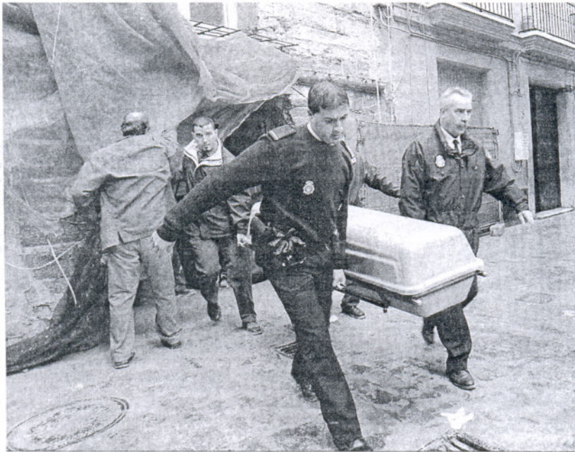
Uno de los últimos siniestros mortales se produjo en abril en una obra en la Casa de Juan Paje de Cádiz.

Los accidentes en el trabajo disminuyeron un 5,8% en la provincia en el primer trimestre, mientras que en Andalucía lo hizo en un 14,9%, según el balance de UGT