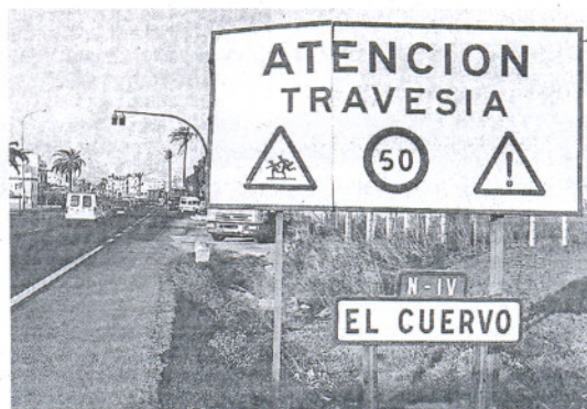
El PP demanda plazos concretos para la obra de desdoble de la N-IV.

Tras las pasadas declaraciones realizadas por la ministra de Fomento, Magdalena Álvarez, en la capital gaditana, Teófila Martí-