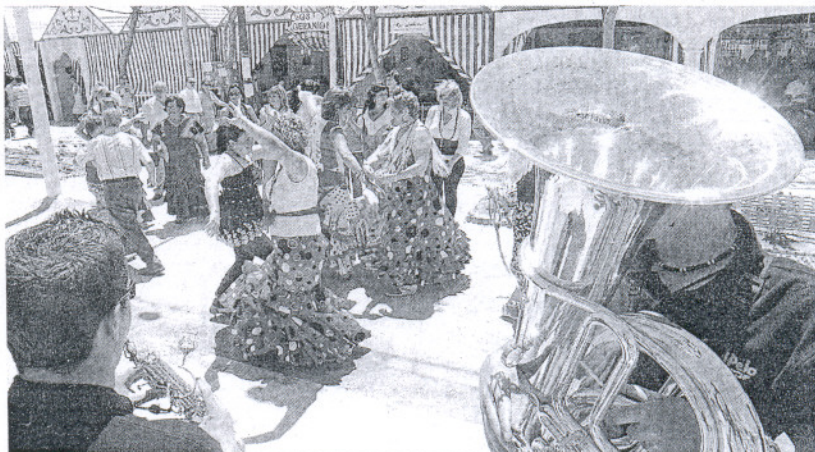
Una charanga improvisa unas sevillanas en el Real.