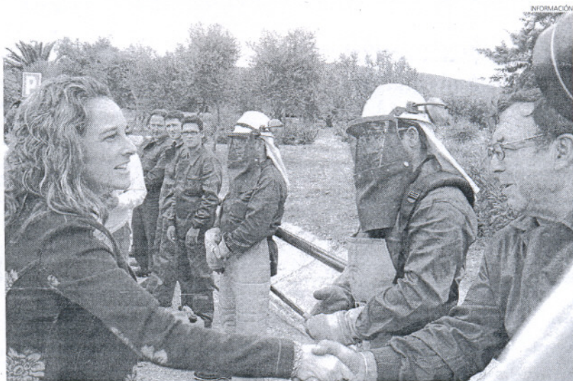
La nueva consejera de Medio Ambiente, Cinta Castillo, presentó ayer el Plan Infoca 2008 en Alcalá de los Gazules.

Entre las novedades de este año, Castillo ha destacado la iniciativa que recurre a una actividad tradicional para la prevención: el pastoreo controlado con ganado para reducir la vegetación y con ello impedir la propagación de incendios. Este año se amplía esta