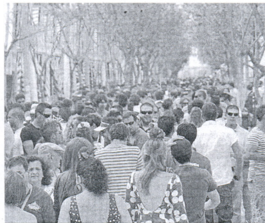
Muchos fueron los visitantes ayer a La Calzada.