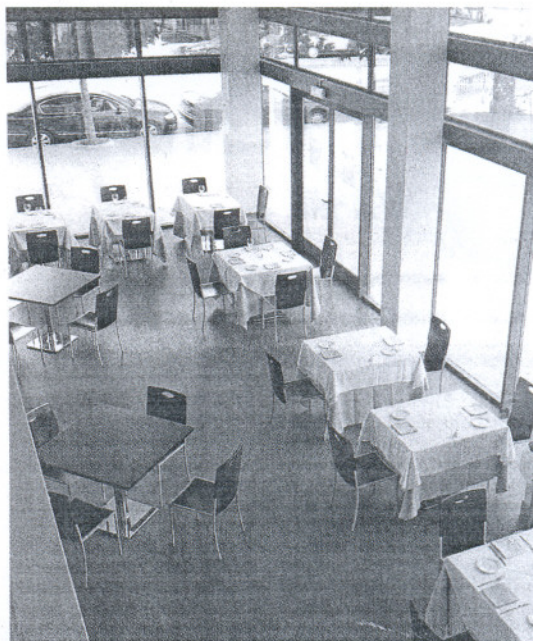
Cafetería de un hotel gaditano.

Mientras disminuye la cifra de turistas en el destino y los hoteles despachan menos estancias, la provincia sigue incrementando su planta hotelera. Más negocios se están repartiendo menos clientela y los beneficios son por tanto menores. El fenómeno ha sido advertido por la asociación provincial de hoteleros: la oferta de alojamiento en Cádiz crece más que la demanda y las consecuencias de este desajuste se agravan en contextos de crisis como el que avanza la temporada.