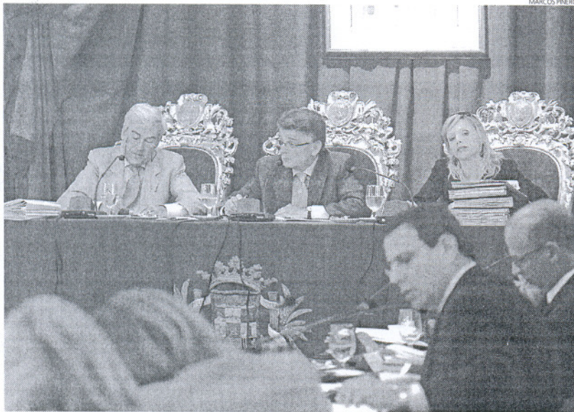
El Pleno del pasado miércoles aprobó la liquidación de presupuestos correspondiente a 2007.