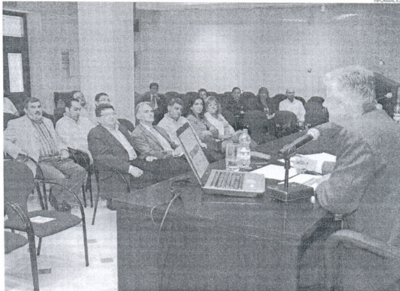
Todos los presentes destacaron la calidad de la iniciativa, que proyectará el turismo en la Bahía.

El acto, en el que estuvieron presentes numerosos miembros del equipo de Gobierno, la Corporación y representantes del sector turístico y náutico de la ciudad, puso de manifiesto el objetivo de este proyecto que supondrá una inversión de unos 8,5 millones de euros, y con el que se pretende dotar a la Bahía de Cádiz de productos diversos, complementarios y diferenciados que impulsen el litoral como recurso turístico, reforzando la competitividad del sector turístico, y man-