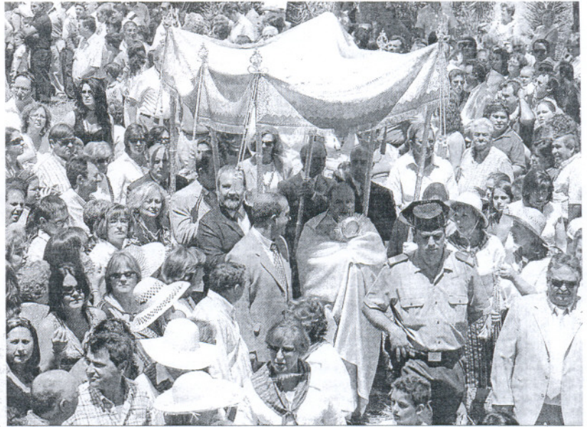
Procesión del Corpus en El Gastor celebrada el pasado año.

Ubrique será otra de las localidades donde se celebre el recorrido procesional, aunque en su caso pendiente del tiempo, puesto que no se desea poner en riesgo el paso de la Virgen de los Remedios, patrona de la localidad, que es el que porta al Santísimo. Tras la misa, también a las doce del medio-