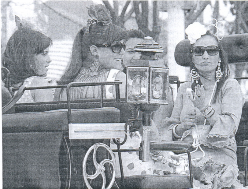
Cuatro flamencas pasean por el Real en coche de caballo.

Quienes no quieren perderse detalle de la programación musical de