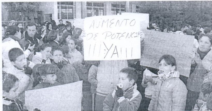
Ayer fue una jornada de huelga con protestas en el colegio Virgen de la Caridad.