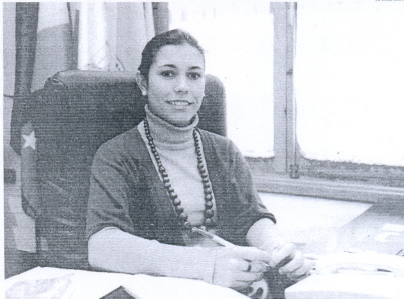
La delegada de Educación ha aclarado que aquellos padres que aún lo deseen pueden apuntarse si hay plazas.

El próximo viernes día 12 finaliza el plazo de presentación de las inscripciones para poder participar; no obstante, Izquierdo ha comentado que aquellos padres que se hayan enterado más tarde y no tengan posibilidad de entregarla ese día, podrán hacerlo más adelante y serán admitidas sus solicitudes, siempre y cuando, queden plazas en los grupos y turnos seleccionados. Los lugares de recogida dentro del plazo establecido son los centros escolares, la oficina de la delegación de Educación, situada en el edificio García Sánchez en la plaza de España o bien a través de fax en el 956 81 53 14. Fuera de plazo será necesario dirigirse a la Delegación de