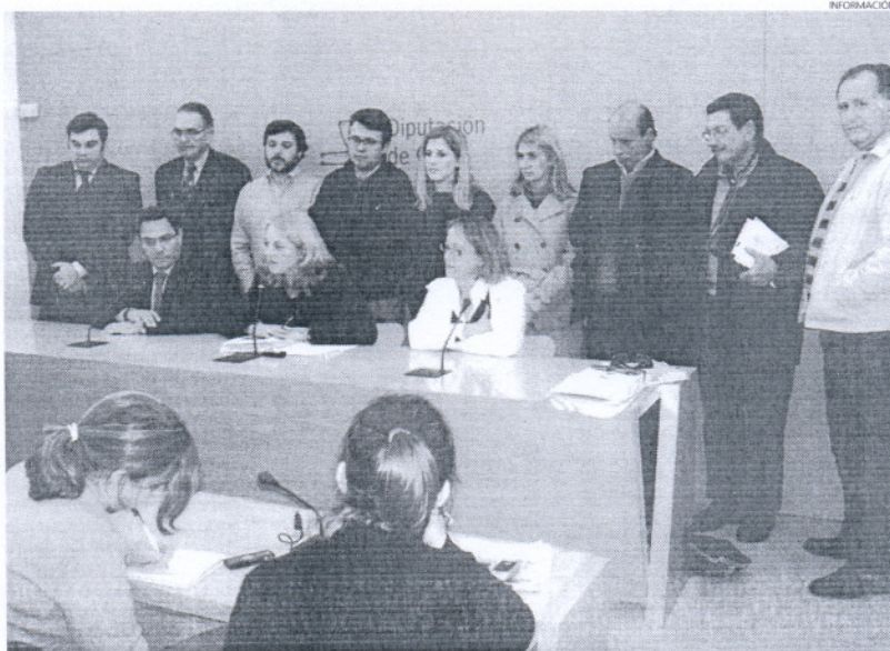
El grupo popular de Diputación compareció unido para pedir la dimisión del actual presidente.