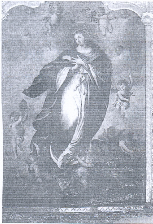
Imagen del cuadro restaurado de la 'Inmaculada Concepción'.

La iglesia Nuestra Señora de la O recibió la obra restaurada