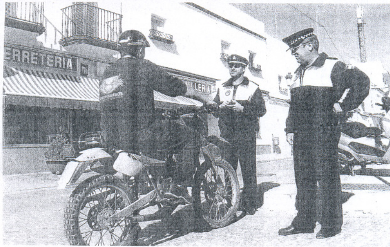
COMPROMISO. Los agentes municipales solicitan una mayor respuesta por parte del Consistorio.

En este sentido, el sindicato quiere aclarar que «no cabe duda de