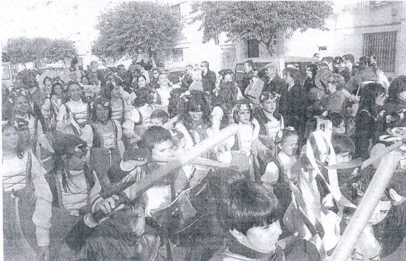
Damas y guerreros del colegio Las Salesianas en la Cabalgata.

La fiesta que se inició el pasado 22 de febrero con el pregón goza en esta edición de una mayor participación con la creación de nuevas agrupaciones de jóvenes