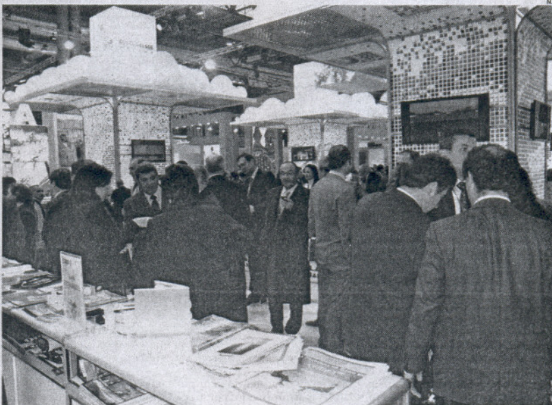
En Fitur, Feria Internacional del Turismo celebrada en Madrid, el stand de Rota tuvo bastante aceptación.

En estos días, el delegado de Turismo, mantuvo también reuniones con los representantes de la ruta del vino y del brandy, así como la participación en una rueda de prensa junto con la Mancomunidad de Municipios, donde se hizo saber cuáles han sido los proyectos aprobados por el Ayuntamiento rotoño. Entre ellos