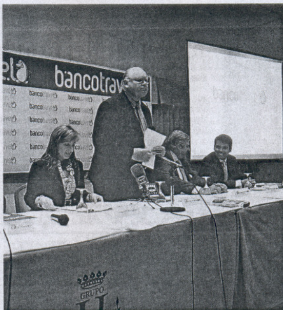
PRESENTACIÓN. La alcaldesa acudió a la cita.

Bancotravel ofrecerá un programa de afiliación para empresas, que permitirá integrar la plataforma por módulos en otras