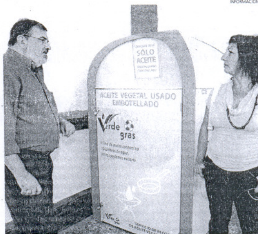
Los nuevos contenedores se encuentran a la entrada de los mercados.

La intención del Ayuntamiento es la de "ir avanzando en la recogida selectiva, de manera que los ciudadanos tengan cada vez más posibilidades para reciclar la basura, cuidando el medio ambiente". De este modo se conciencia a los ciudadanos del beneficio que supone esta recogida selectiva, y es que un litro de aceite doméstico puede llegar a contaminar mil litros de agua.