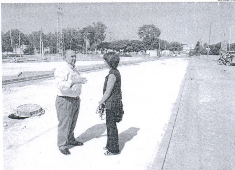
El R7 es un sector con gran proyección de futuro que contará con un amplio parking, equipamientos y zonas verdes.

También se ha proyectado el futuro desarrollo de una zona de equipamientos