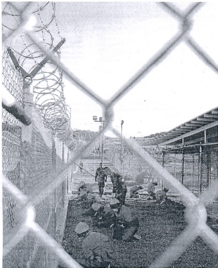
SIN DERECHOS. Presos acusados de pertenecer a Al-Qaeda, en la base de Guantánamo.