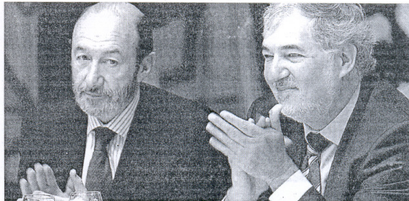
El ministro Rubalcaba y el fiscal general del Estado, Conde-Pumpido, en un acto oficial.

«Cada caso es distinto, el fallo del Supremo no es generalizable», zanjaron los responsables del Ministerio Público, que sólo estudian proponer «ajustes», no grandes cambios, para mejorar la lucha contra las células «yihadistas», como introducir en el Código Penal el delito de proselitismo radical, ya que es difícil encuadrar o la difusión de ideas integristas en el ilícito de enaltecimiento del terrorismo.