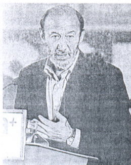
Alfredo Pérez Rubalcaba.

En un acto del PSOE celebrado anoche en Medina Sidonia, el también diputado nacional por la provincia de Cádiz no se cansó a