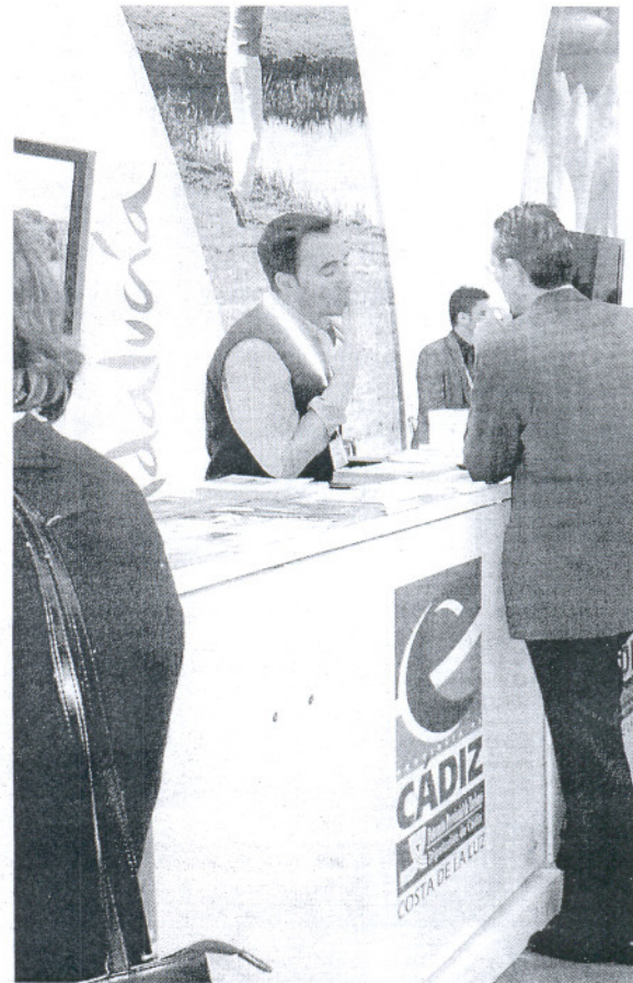
PROFESIONALES. La feria vivió ayer el día de mayor actividad