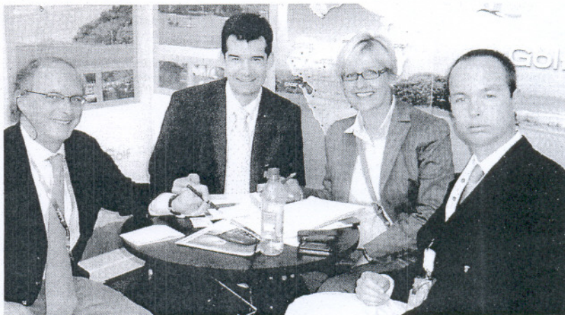
ENCUENTROS. Los directivos de los campos atienden en la feria a numerosas citas.

Rewe espera crecer hasta traer a Cádiz a 40.000 viajeros alemanes en 2010