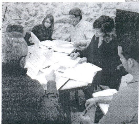
El encuentro sirvió para valorar las necesidades de la Costa Noroeste.

En definitiva, los representantes de los tres ayuntamientos junto con la Mancomunidad del Bajo Guadalquivir abordaron, según informó el alcalde, "en un ambiente de cooperación y entendimiento" qué nuevas actuaciones que se podrían emprender para promocionar el uso de las playas en este mismo año.