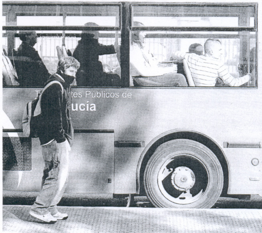
EN LA PARADA. Un joven aguarda a su autobús mientras pasa uno de Comes.