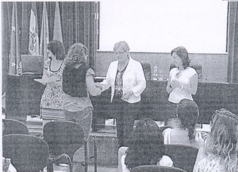
Los padres y madres participantes recogieron sus diplomas de participación en esta Escuela Educativa.

La Escuela de Padres, organizada por la Delegación municipal de Educación a través del Gabinete municipal Psicopedagógico, bajo el lema Aprendiendo a ayudar a nuestros hijos , ha tratado en este año nuevos temas de interés que en el caso de los padres con hijos en Secundaria se han centrado en asuntos como la comunicación,