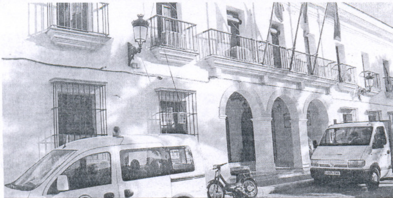
Imagen de la fachada del Ayuntamiento de Trebujena.

Casi cinco millones son para la empresa de vivienda y suelo