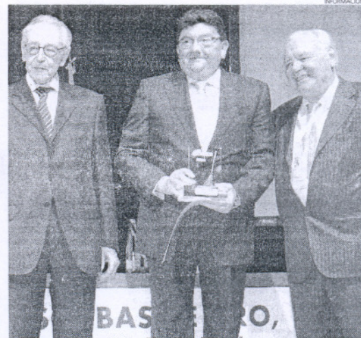
El propio alcalde recogió en Madrid este galardón a la limpieza local.

Este reconocimiento, que sitúa a la localidad entre las más limpias de España, valora la implantación de avances tecnológicos en los servicios, o la realización de campañas de concienciación.