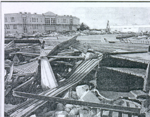
Continúan las obras para la llegada de nuevas empresas.

El paro se extendió también a otros centros formativos en la Bahía, como San Fernando, El Puerto o Jerez. Desde el colectivo de ex trabajadores, criticaron que aún no hayan recibido una respuesta acerca de cuál es el proble-