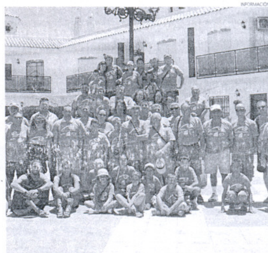
Los participantes, momentos antes de salir a la calle cámara en mano.

Desde la Fundación Municipal de Turismo se ha realizado una encuesta entre los participantes para conocer sus impresiones sobre esta iniciativa municipal.