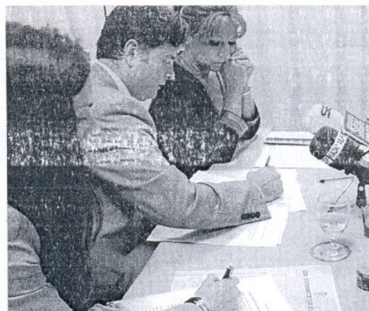
El convenio se firmó ayer en el Ayuntamiento de Vejer.

Ortiz explicó que "Desarrollos Eólicos desarrollará proyectos eólicos en el término municipal de Vejer y tramita las autorizaciones administrativas necesarias para su construcción, puesta en marcha y explotación". Dichos proyectos tienen derechos de conexión por un total de 87,5 MW en virtud de la Resolución de fecha 23 de enero de 2006 de la Dirección General de Industria Energía y Minas, y también gestiona proyectos para crear las infraestructuras eléctricas necesarias para la evacuación de la energía producida.