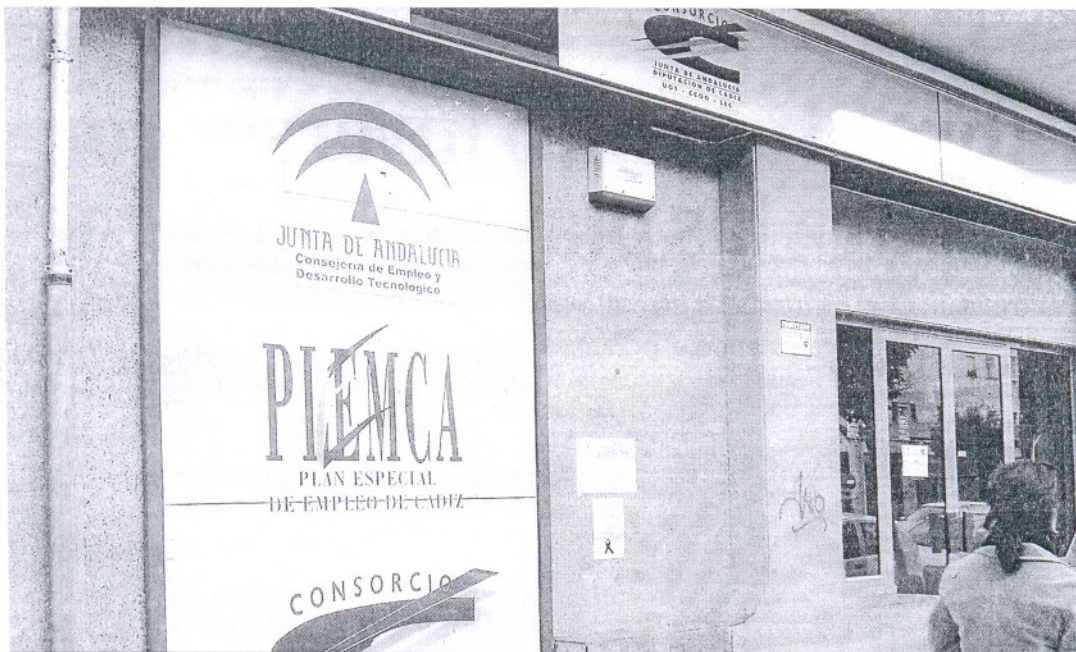
Imagen de la sede del Plemca en Cádiz, clausurada ya desde hace tiempo.