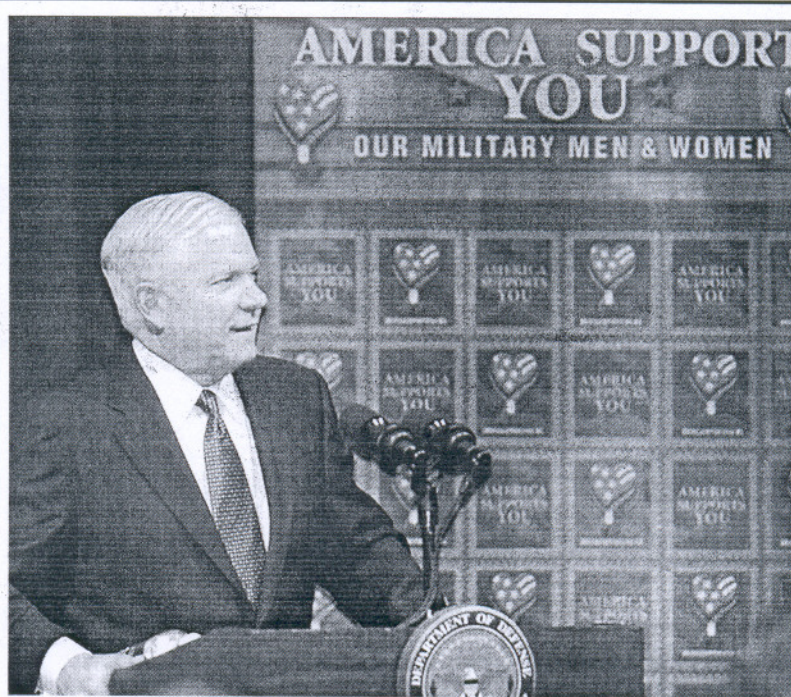
Robert Gates, secretario de Defensa, en una conferencia de prensa en el Pentágono

Los cuarteles Kelley de Stuttgart se mantendrán, de este modo, como base permanente para los intereses en África, que van más allá del control de las posibles células terroristas, ya que los