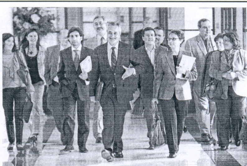
José Antonio Griñán y parte de su equipo, antes de comparecer ayer en la comisión del Parlamento.