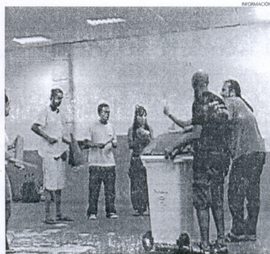
Lo menos pensado se puede transformar en un instrumento.

El Área de Juventud continuará con sus actividades veraniegas hasta el último momento posible y así, tendremos los conciertos de los grupos musicales El Beso de Judas y Palike ofrecerán el sábado 30 de agosto, en la Tenencia de Alcaldía de Costa Ballena; o el espectáculo de circo con malabares y clown que presentarán ese mismo sábado día 30 en la plaza de La Cantera la Asociación Local McBonaro.