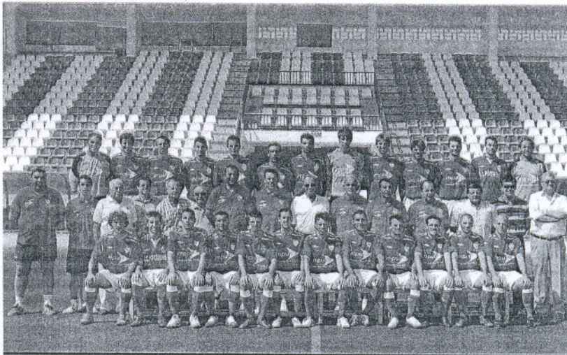
Foto oficial. La plantilla del Racing para la campaña 2008/2009 presenta una renovación profunda. La directiva quiere así olvidar el ejercicio anterior, en el que

lunes empezará a rellenar la parcela del polígono de Las Salinas donde se ubicará el nuevo estadio "para ir adelantando" y expresó la voluntad municipal "es la de que todo se desarrolle cuanto antes", de forma que se pueda contar con una instalación "con