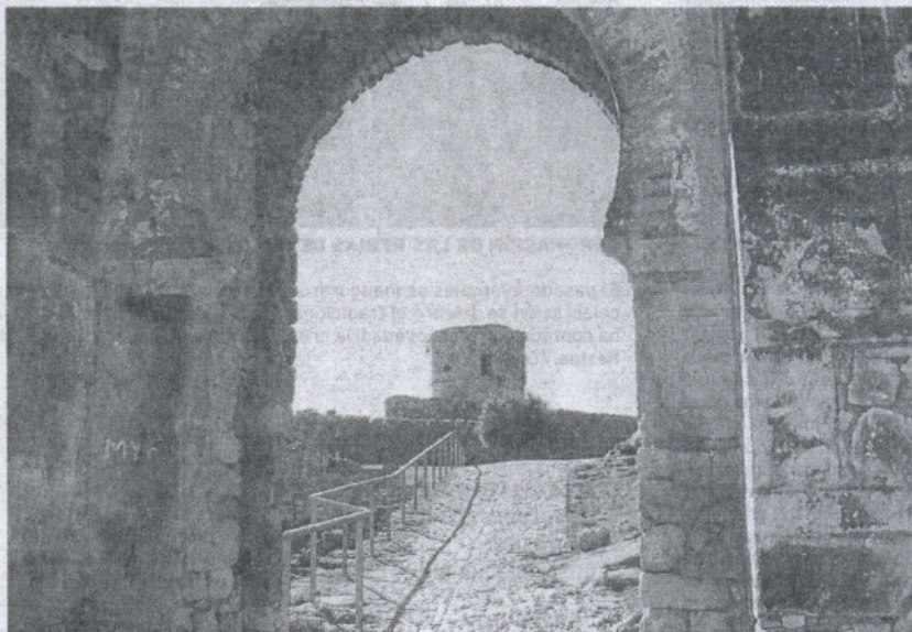
ENCANTO. La Junta apoyará especialmente a proyectos de alojamientos con encanto.

En Chipiona, la inversión total ascenderá a 5,8 millones para la rehabilitación o ampliación de dos hoteles de cuatro estrellas. Otros dos proyectos jerezanos necesitarán 4,3 millones de euros. En el caso de Jimena, la Junta ha reci-