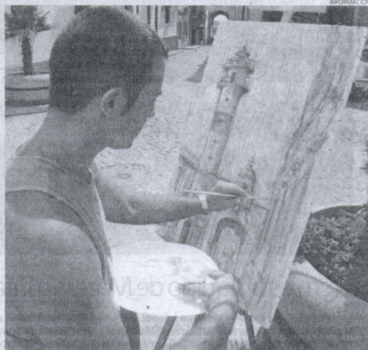
Los artistas transformaban en pocas horas lienzos blancos en obras.