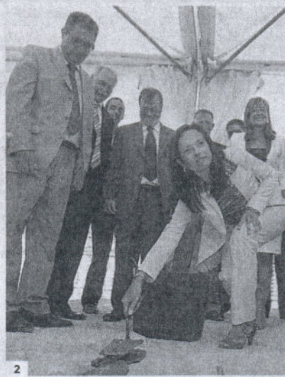
1. La ministra de Vivienda, en los jardines que rodean al Palacio de los Infantes, en Sanlúcar. 2. Beatriz Corredor, en la colocación de la primera piedra en Jerez. 3. La alcaldesa de Sanlúcar, Irene García, con la ministra.