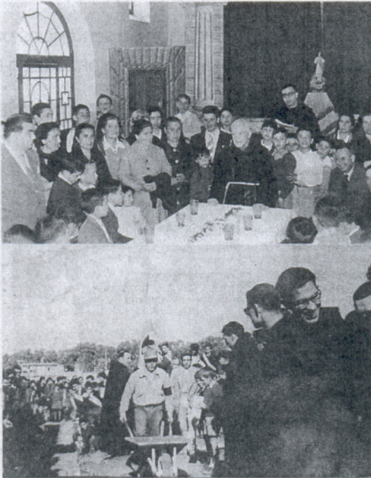
Imágenes de los años 60 de la historia franciscana.