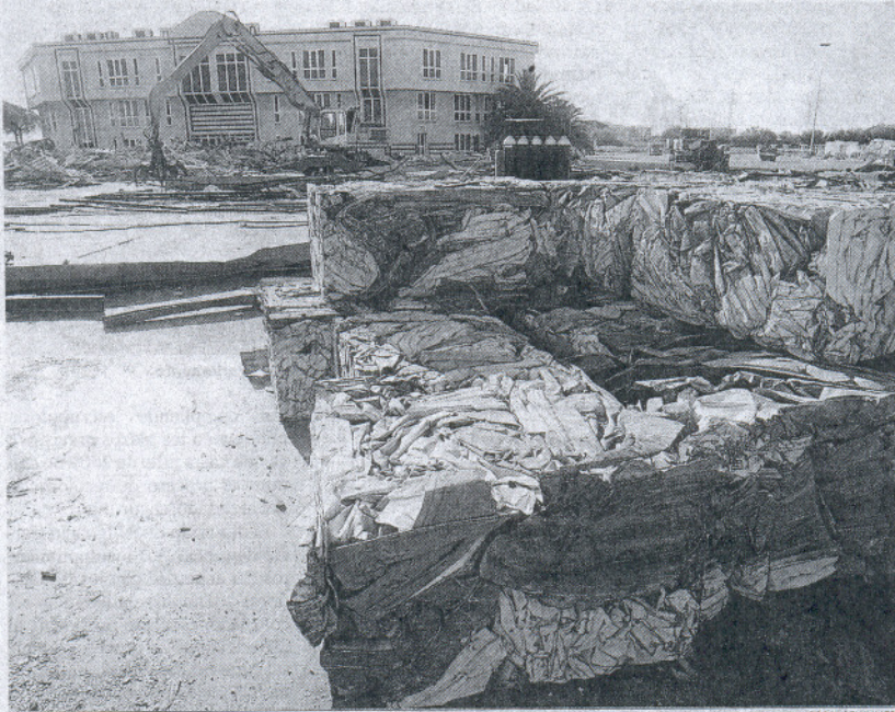
Obras para la instalación de Gadir Solar en las antiguas dependencias de Transportes Carrillo, en Puerto Real.

Gadir Solar (fabricación de paneles solares), ya ha empezado las obras en Trocadero, en las antiguas naves de Carrillo "y probablemente comenzarán la actividad a mediados del próximo año". Su inversión es de 94 millones de euros y generará 250 empleos. La empresa, cuya plantilla al 50% será ocupada por mujeres, iniciará en 2009 la formación específica, en la que tendrán cabida unos 50 ex emplea-