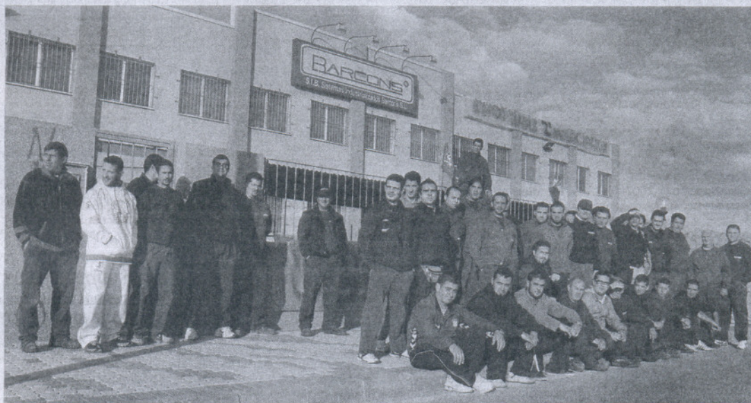
La plantilla de la empresa Barcons emprendió ayer una intensa protesta en las instalaciones del Polígono Las Salinas de El Puerto.

Por eso desde el Partido Popular exigen al Gobierno de Zapatero un nuevo modelo de financiación local, que se haga simultáneamente a la de las comunidades autónomas y piden al presidente socialista que “deje de presumir de políticas sociales, cuando el 80% la financian los consistorios”. “Después dirá que las empresas quiebran porque los ayuntamientos no pagan”, sentenció.